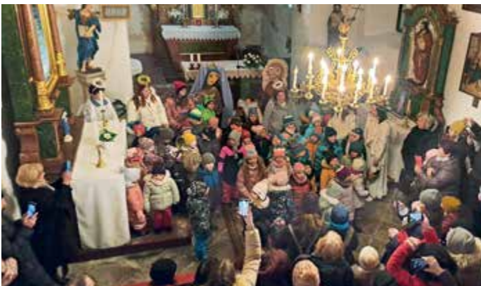
MŠ na cestě do Betléma