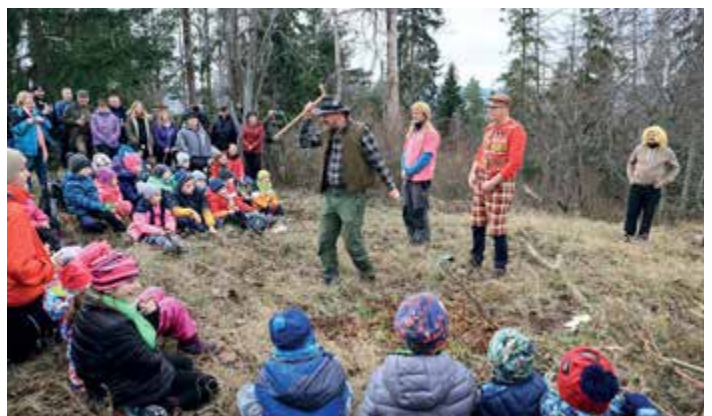
Národní divadlo Čkyně na Silvestra