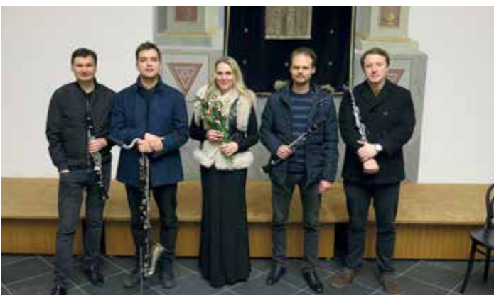
Klarinetový soubor Prachatice