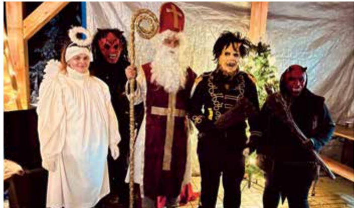
Čerti ve Spůli