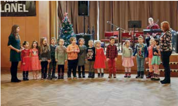
Děti z mateřské školy na posezení pro seniory ve Čkyni