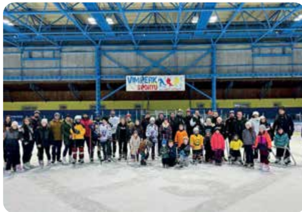
Aktuální informace společně s fotografiemi ze soutěží, tabulkou a dalšími statistikami naleznou zájemci na https://mhlvimperk.estranky.cz/ .