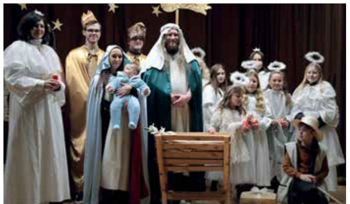
Živý betlém 2023