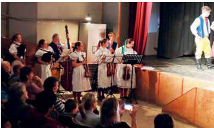
Prácheňáček a dudáci ve Čkyni