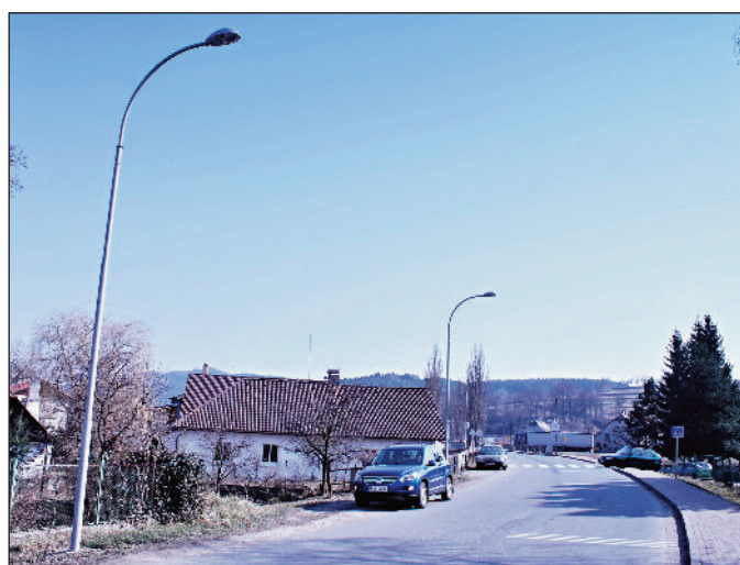
Oprava části veřejného osvětlení Čkyně