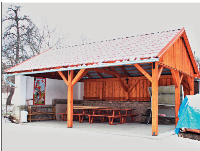
Přístřešek SDH Čkyně