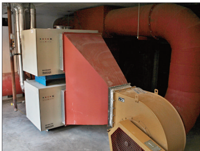
Plynová kotelna pro sál a kinosál