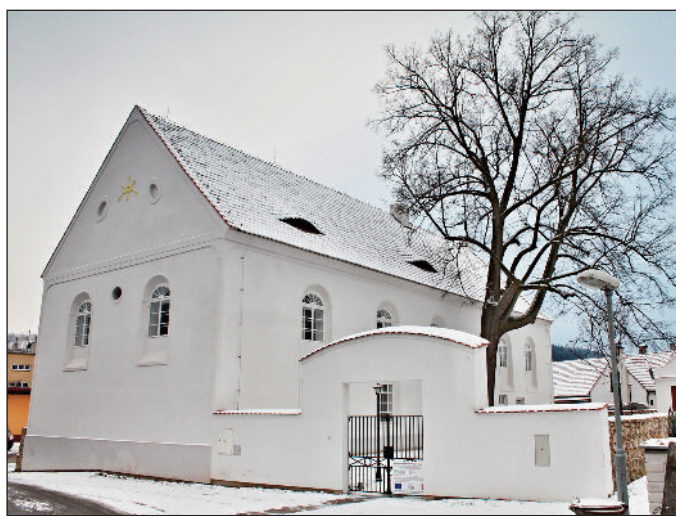
Oprava synagogy ve Čkyni – exteriéry