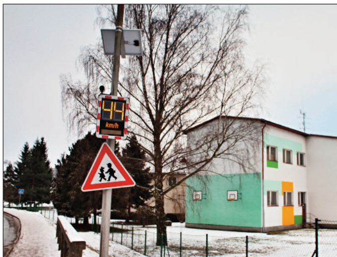
Ukazatel rychlosti u ZŠ