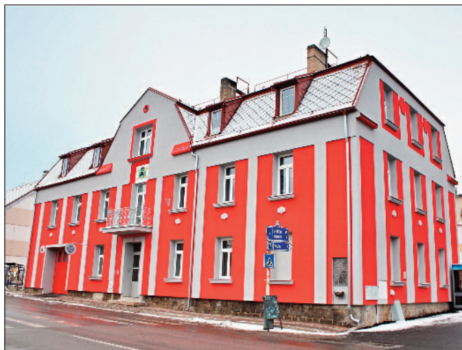
Zateplení domu č. p. 134