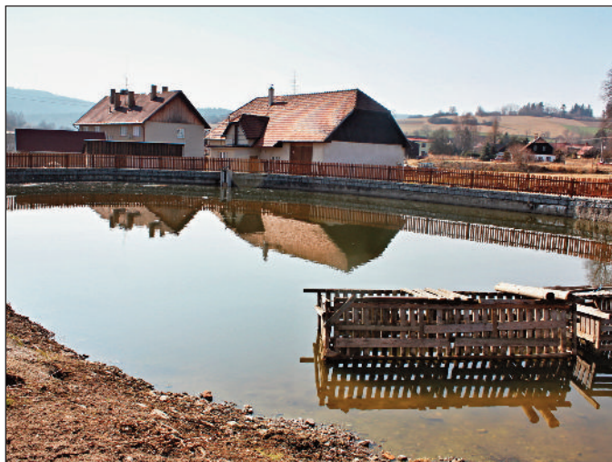
Obnova požární nádrže Onšovice