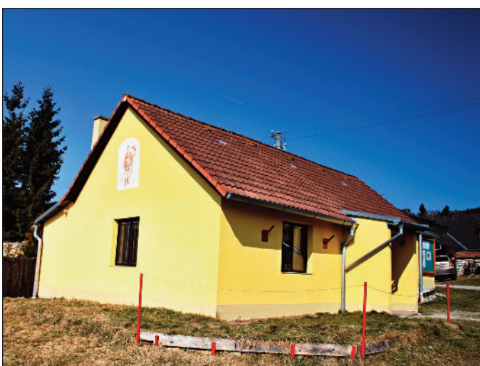
Oprava hasičské zbrojnice Horosedly