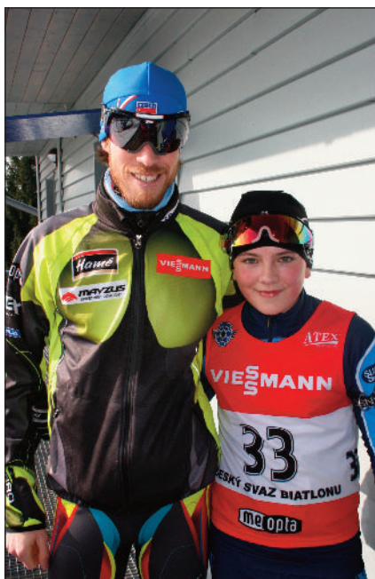
Ondra s olympijským medailistou Jaroslavem Soukupem

Nespočet hodin se vzduchovkou v ruce při tréninku střelby během dvou týdnů přinesl své ovoce a Ondra začal sbírat úspěchy o několik tříd lepší.