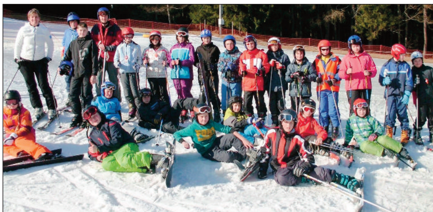
Žáci na lyžařském kurzu na Kubově Huti

miss (někteří kluci se převlékli za dívky a soutěžili v různých disci-