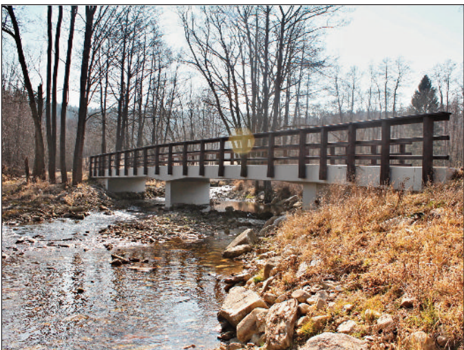
Oprava mostu v Onšovicích