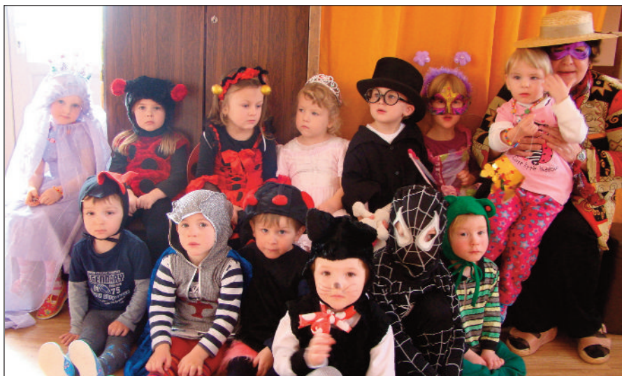
Děti z první třídy MŠ