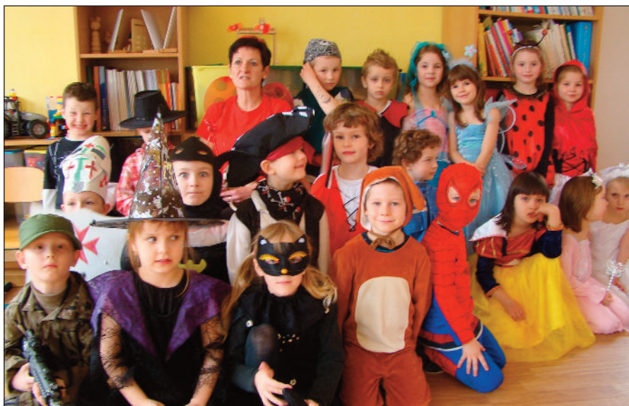
Děti ze třetí třídy MŠ