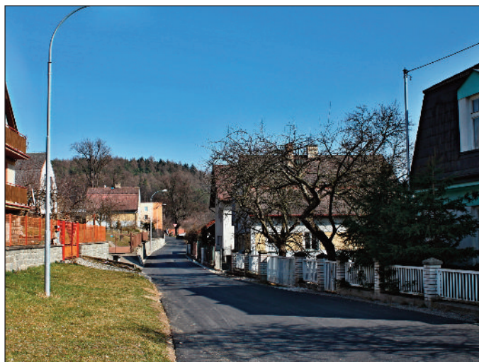
Obnova komunikace od DPS k bytovkám