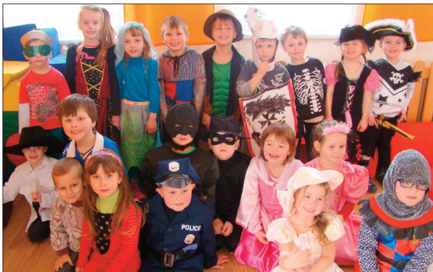
Děti z druhé třídy MŠ