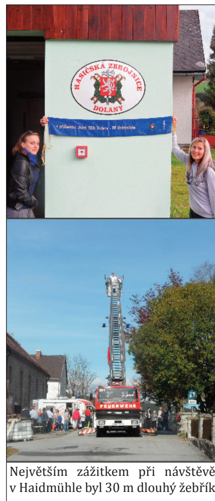
Největším zážitkem při návštěvě v Haidmühle byl 30 m dlouhý žebřík