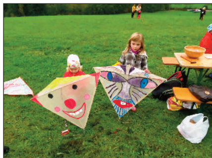
Krásné draky měly sestřičky Bízkovy

Tak jako minulý rok i letos na naší drakyjádu nedorazil nejdůležitější člen celé akce - vítr. Přesto i letos byla účast hojná. Zúčastnilo se přesně dvacet dětí, některé jsou již stálými, ale objevily se i nové tváře.