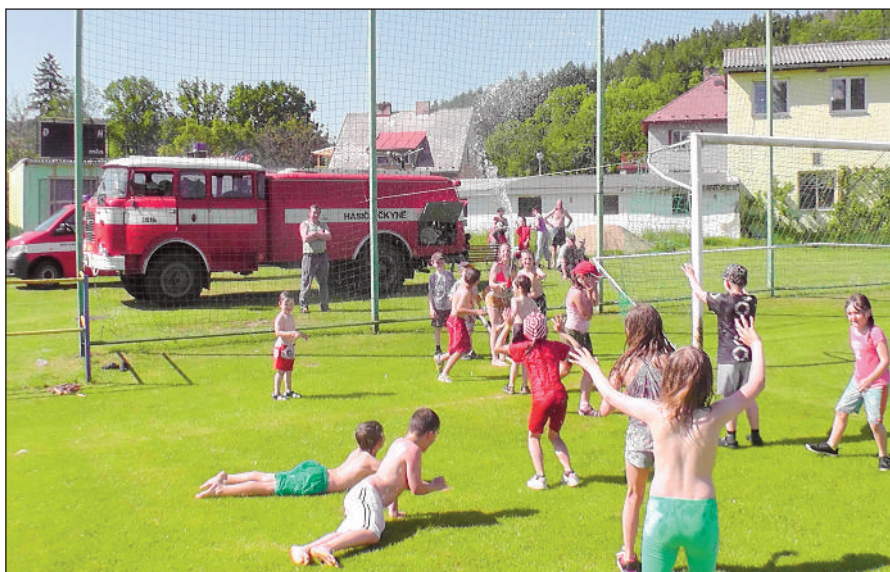
Osvěžující sprcha z hasičské stříkačky