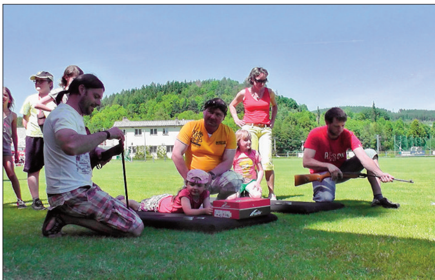
Střelba ze vzduchovky patří k nejoblíbenějším disciplínám