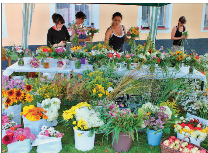
Nechyběl ani tradiční a oblíbený květinový stánek KOS