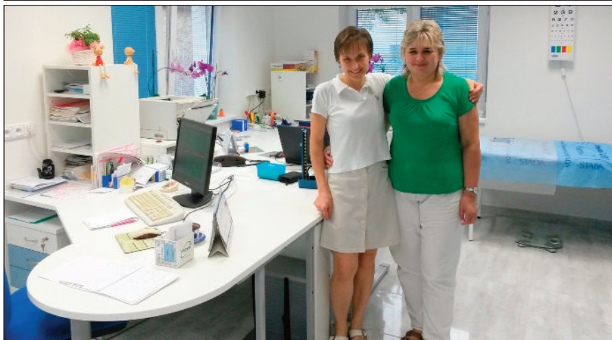
Pacienty čeká příjemné a moderní prostředí