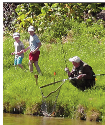
Jeden z úspěšných rybářů