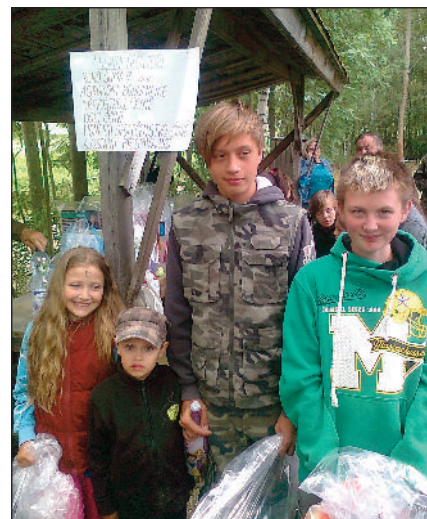
Vítězové dětského rybářského dne