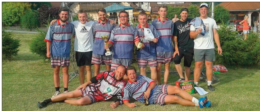
Šťastný vítězný tým

V sobotu 28. června se na hřišti „na rovince“ uskutečnil čtvrtý ročník fotbalového turnaje s názvem Čkyně Cup. V letošním roce se ho zúčastnilo vůbec poprvé 12 týmů, které se utkaly ve třech skupinách po čtyřech mužstvech.