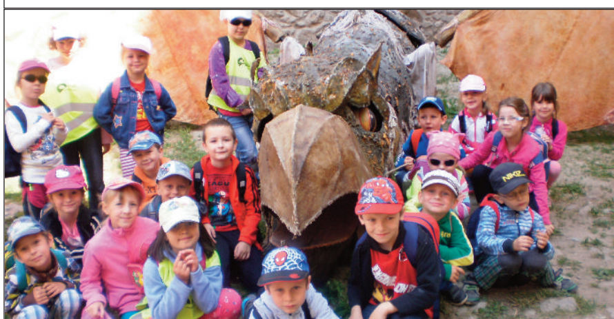
Předškolní děti na výletě ve Vimperku