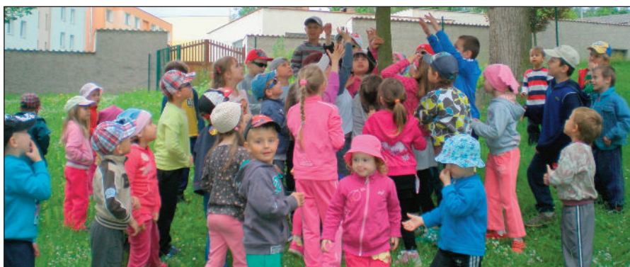
Den dětí v MŠ – hledání pokladu