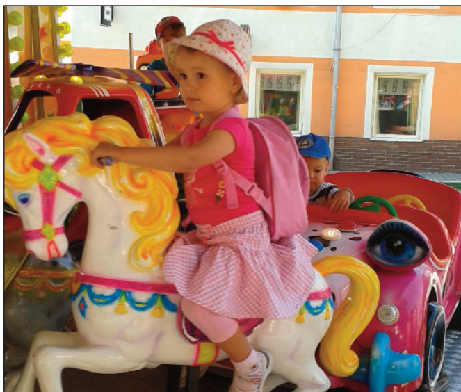
Děti si užily poutěvé atrakce, některé i poprvé v životě