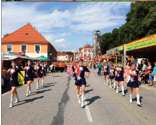
Vystoupení vimperské dechovky a mažoretek bylo jako každý rok skvělé