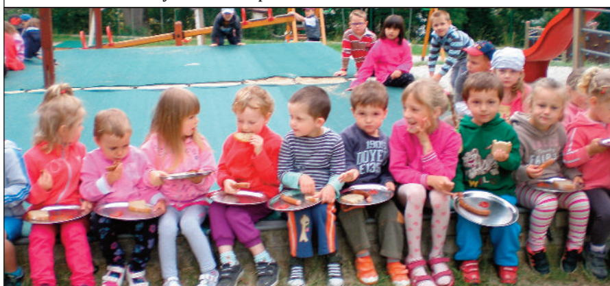
Na závěr školního roku si děti s učitelkami opekly vuřty