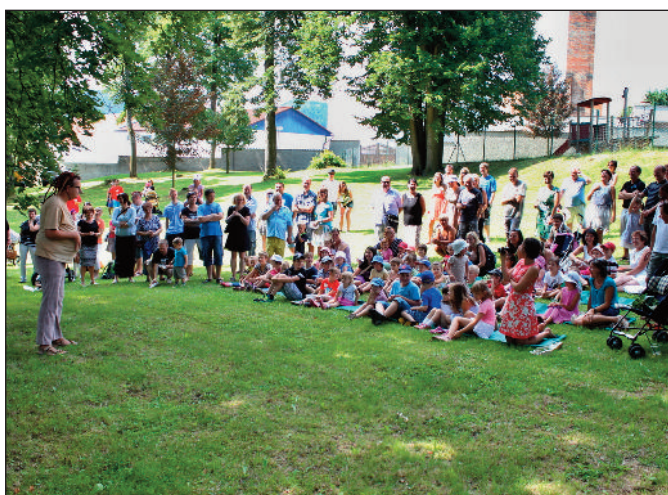
KOS si připravil pro děti veselou pohádku O Otesánkovi