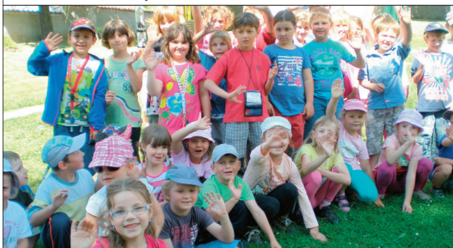
Prvňáčci na návštěvě v MŠ