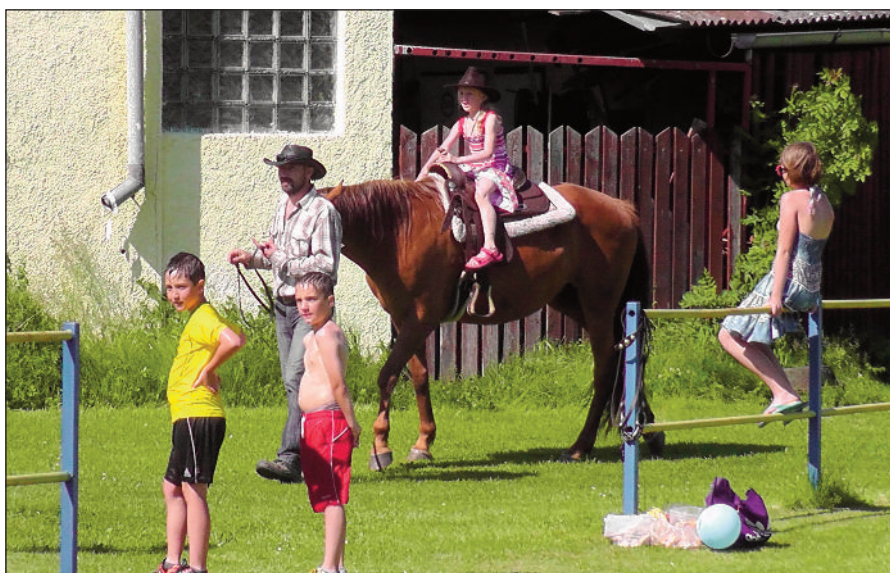
Projíždku na koni děti přivítaly s nadšením