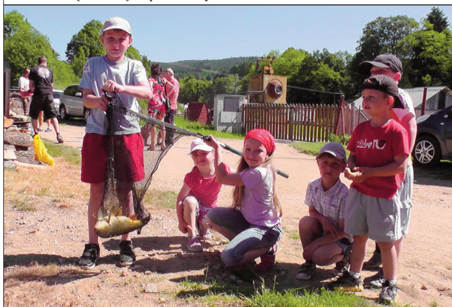
Rybářské závody si užily i děti, které s lovem vydatně pomáhaly