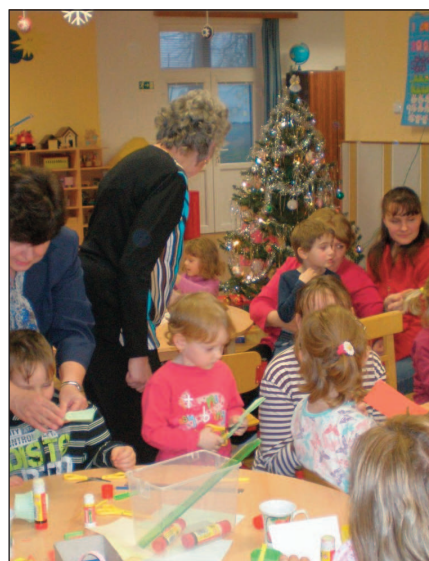
Vánoční tvořivá dílna