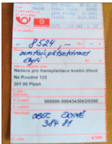
Peníze putovaly na účet nadace poštovní složenkou