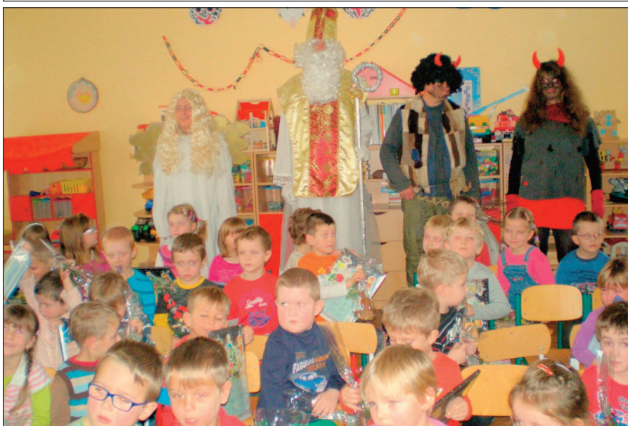
Mikuláš v mateřské školce