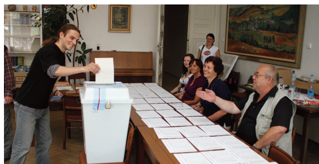
Volby ve Čkyni

Čkyně v %: ČSSD 23,0 ODS 20,6 TOP 09 15,0 KSČM 10,4 VV 9,2 KDU-ČSL 4,0 SPOZ 6,1 Volební účast: 64,3 %