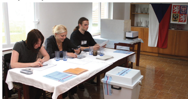
Volby v Dolanech