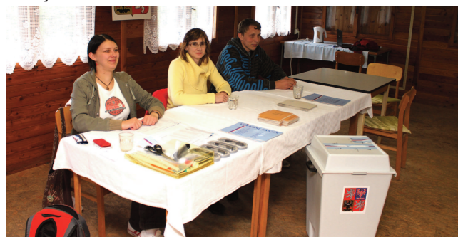
Volby v Onšovicích