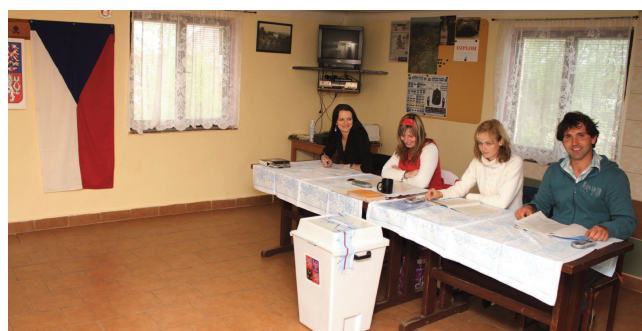
Volby v Horosedlech