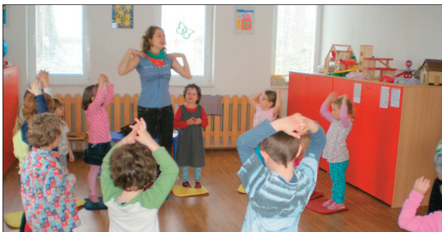
Děti si program „Život broučků“ moc užily

Celý program byl provázán básničkami, písničkami a ukázkou krásných modelů broučků. Na závěr si děti obkreslily na papír vybraného broučka a vybarvily. Nebo si také pomocí kartonu a kříd mohly vyzkoušet