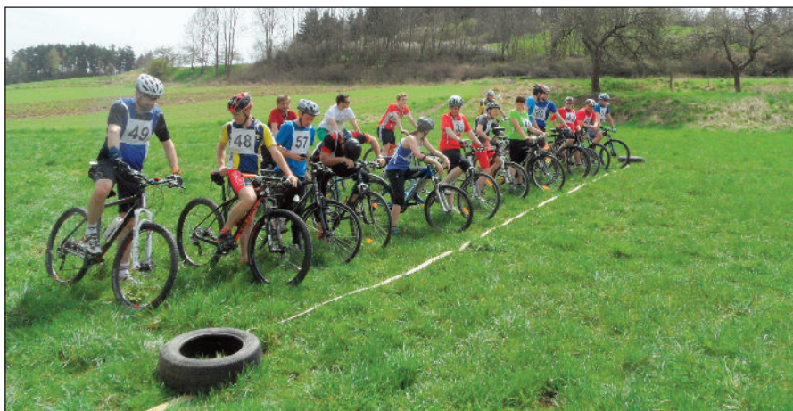
Start Dolanského dualtonu

Ale abych nechválil jen hasičská děvčata, exkurze do Pasova a stavby „máje“ se účastnilo i dost našich