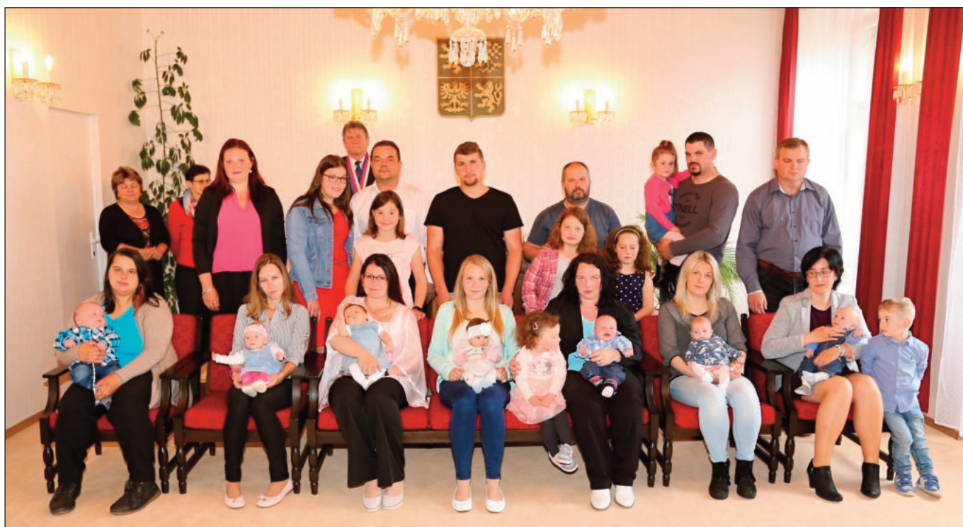
Vítání občánků 11. 5. 2019