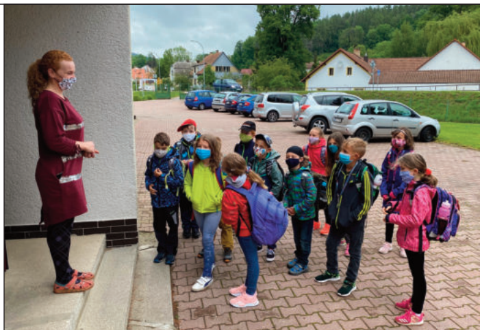
Děti musí čekat na příchod učitelky ve stanovený čas v rouškách před školou a pak jdou společně do třídy