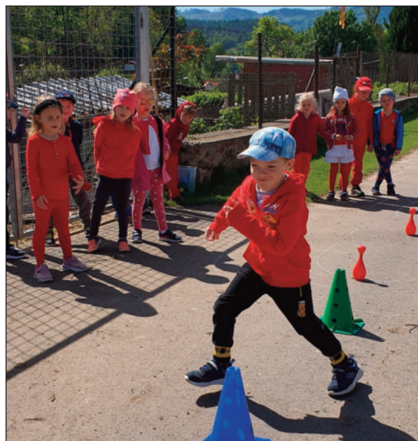
Den dětí ve školce