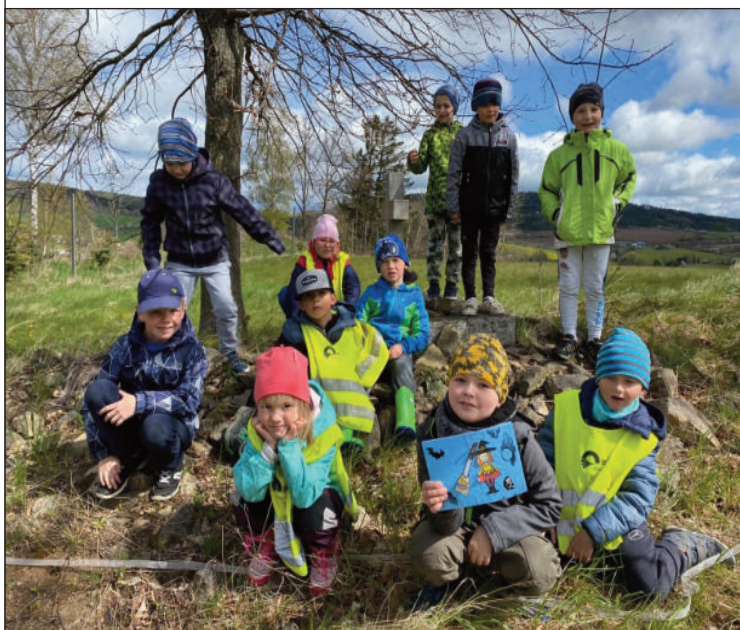
Děti na čarodějnické stezce