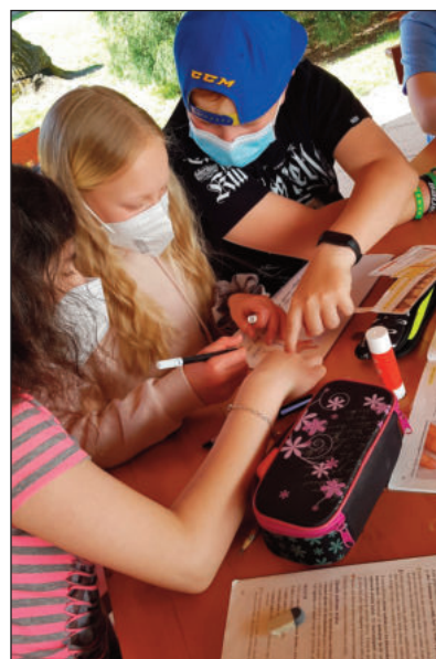
Učení venku v altánu

Na stránkách školy jsou informace o soutěžích a zápolení našich žáků. Vážíme si těch, kteří si ve všem tom shonu našli chuť a čas udělat něco navíc. Takovým naši učitelé rádi pomohou, taková práce přináší radost. Všechny soutěže probíhaly pochopitelně v on-line prostředí.