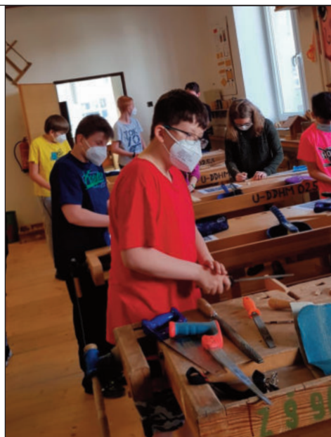
Dílny po dlouhé době ožily