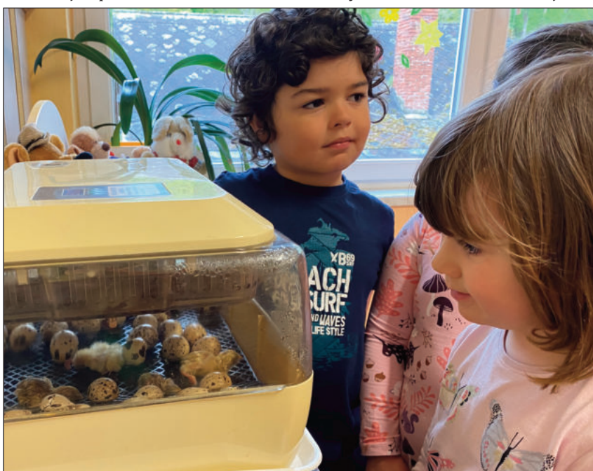
Děti ve školce tři dny pozorovaly líhnutí křepelky