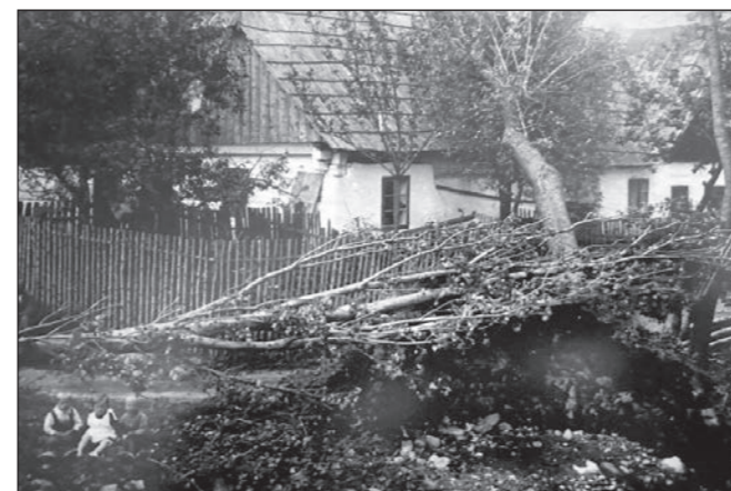
Povodně třicátá léta. Pravděpodobně vyfocení bratři Hrašovi se sestřenicí.

Já osobně ve Čkyni nikdy nebyla a znala z příbězence pouze mladší sestru své prababičky – tetu Františku. Pouze jsem věděla, kde se předci narodili. Při náhodném průjezdu Čkyní