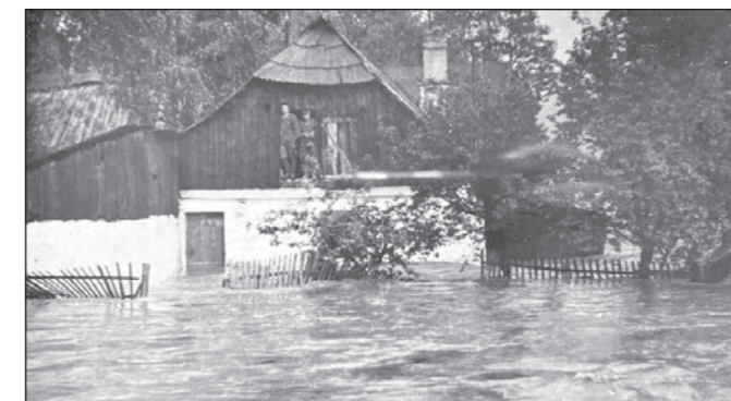
Povodně padesátá léta. Na půdě bratři Hrašovi.

Zkušenosti s rekonstrukcí máme, vlastními silami jsme opravili chalupu u Jičína a také zachovali typické vesnické stavení. V případě čkyňské chaloupky budou větší stavební zásahy provádět odborné firmy, které se na tyto práce specializují. Drobné stavební práce, jako je např. omítání, budeme provádět sami s použitím původních materiálů. Renovace starých objektů nás baví a zároveň naplňuje dobrým pocitem, že uchováme kousek historie pro další generace.