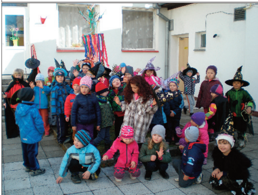
Čarodějnický rej pod májkou ve školce