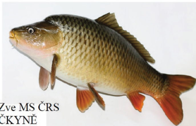
Zve MS ČRS ČKYNE

Možnost rybolovu i bez rybářského lístku.