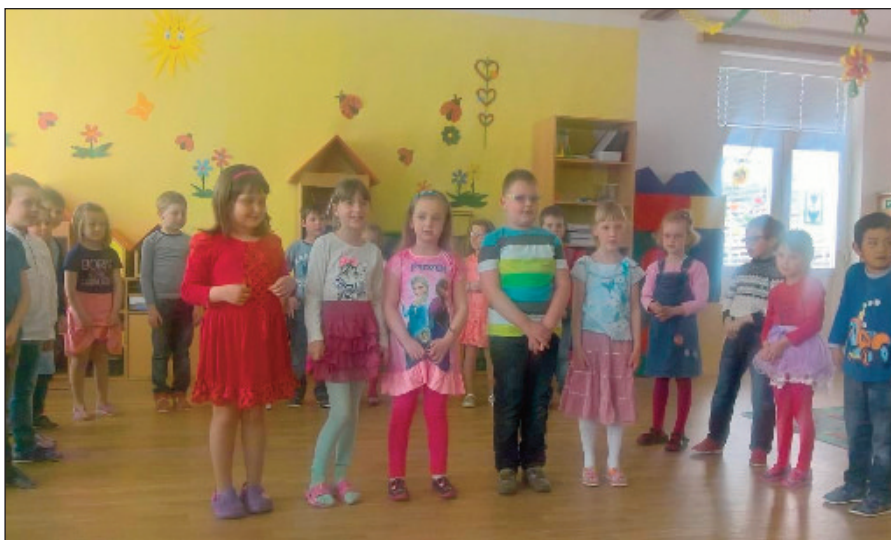
Děti z třetí třídy