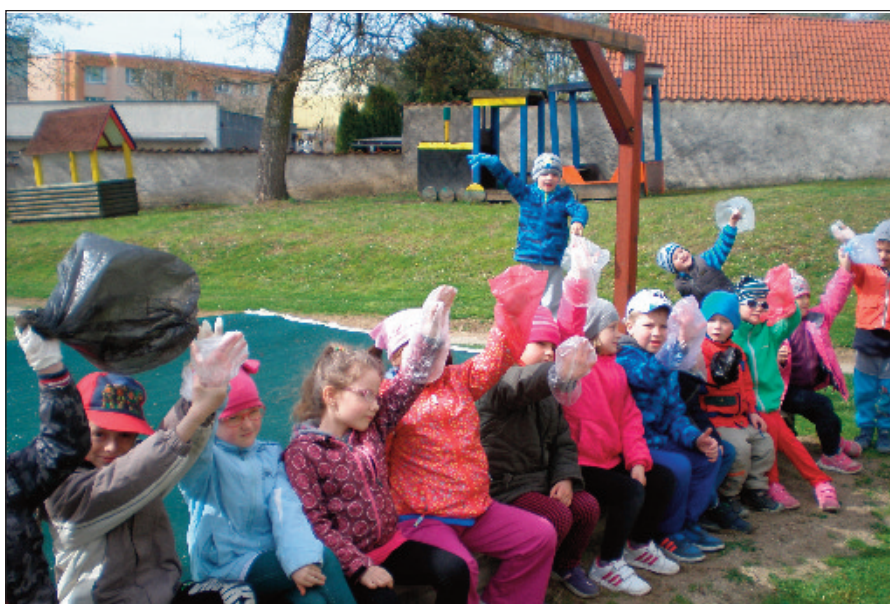
Mezinárodní den Země