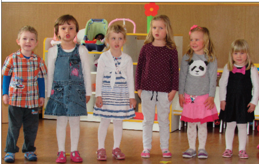
Děti z první třídy