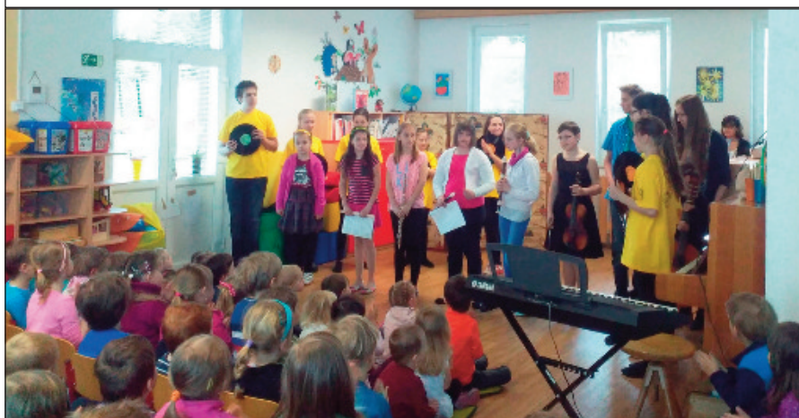
Výchovný koncert ZUŠ ve školce