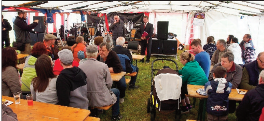
Akce se zúčastnily zhruba tři stovky lidí