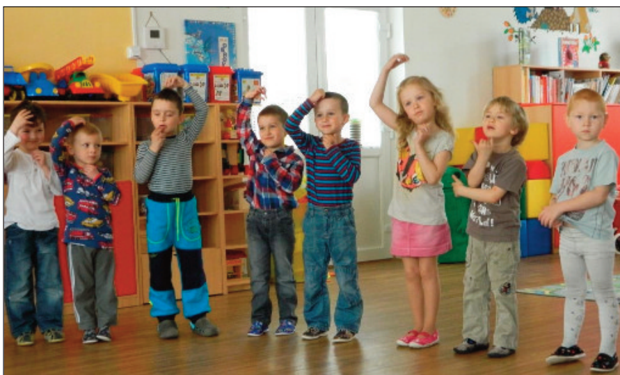
Děti z druhé třídy