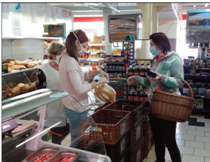
Prodej pečiva v potravinách má svá přísná pravidla