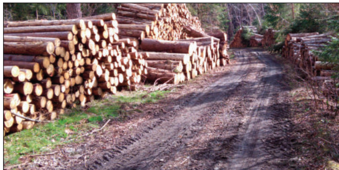
V obecních lesích se hromadí velké množství vytěženého dříví, které se nedá prodat.

Na Čkyňsko se kůrovec šířil také dálkově vzdušnými proudy z lesů Národního parku Šumava, kde r. 2017 po dvou orkánech vznikly rozsáhlé polomy, které v bezzásahových lesích zůstaly nezpracovány. V důsledku vyhlášení bezzásahových zón od 1. 3. 2020 na rozloze 53 % území NP Šumava zůstanou polomy ze dvou nedávných orkánů nezpracovány. V důsledku uvedených skutečností a srážkově podnormální zimy téměř bez sněhu lze očekávat v lesích na Čkyňsku šíření kůrovce v rozsahu ještě větším než v předchozím roce.