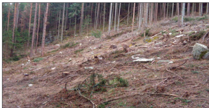
Holiny po kůrovcové těžbě dříví v obecních lesích ve Spůli.

Třetí vykácená holina o rozloze cca 2 ha (je na konci dolní Spůle pod skálou) se v letošním roce zřejmě rozšíří v důsledku šíření kůrovce od sousedních soukromých vlastníků. Nedaleko se nachází stará kůrovcová 3 ha plocha, vzniklá již před několika lety, a má několik vlastníků. Stovky kubíků dříví tam leží na zemi nezpracovány. Ani tento extrémní kamenitý svah není znemožněním vyklizení dříví. A hlavně, nevyklizená plocha dnes brání přístupu ke zpracování aktivních kůrovcových stromů po obou stranách svahu.