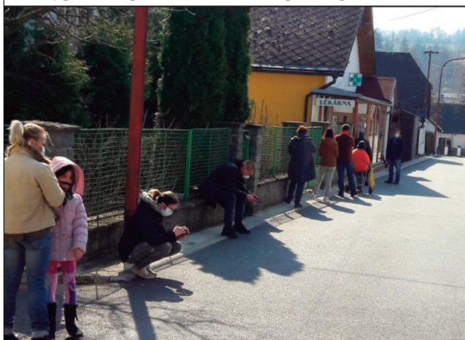
Fronta před lékárnou – lidé v rouškách dodržují rozestupy alespoň jeden metr, stejná fronta bývá i před budovou pošty