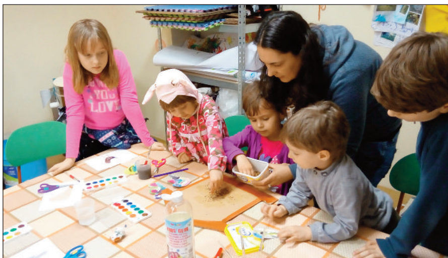
Děti na kroužku Hravé tvoření

Připravujeme toho hodně i na duben a květen. Podrobný program vždy visí na plakátech, na webu www.kosckyne.cz a na facebookových stránkách Mrňouskové. Od dubna jsme upravili věkovou hranici u kroužku Hravé tvoření, dříve bylo zaměřeno na děti od 3 do 4 let. Nyní bychom rádi pozvali všechny předškolní děti, tedy ve