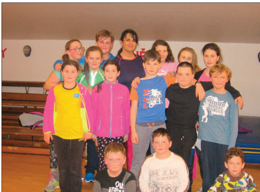
Mladší a starší žáci

Naším hlavním cílem je snaha přivést do tělocvičny, co nejvíce dětí. V dnešní době to není úkol zcela lehký, přesto se i letos podařilo získat jak zájem malých příznivců sportu o pravidelné cvičení, tak starší chlapce pro florbal a dívky pro odbíjenou. Pouze náš nový oddíl pro nejmenší předškolní věk Rodiče a děti je v současnosti málo využíván. Doufáme proto, že i do těchto zajímavých hodin přivedou rodiče své ratolesti a věnují jim hodinku plnou her a veselého cvičení na nářadí či s novým náčiním. Nově jsme pro děti v letošním roce připravili celoroční hru „Poďte se hýbat se sportíky“, na jejímž začátku bylo vyhlášení grantového programu Podpora sportovní činnosti dětí a mládeže v rámci spolupráce ČOV a Jihočeského kraje. Díky schválenému projektu se tak ti nejmenší mohou radovat z nových cvičebních prvků,