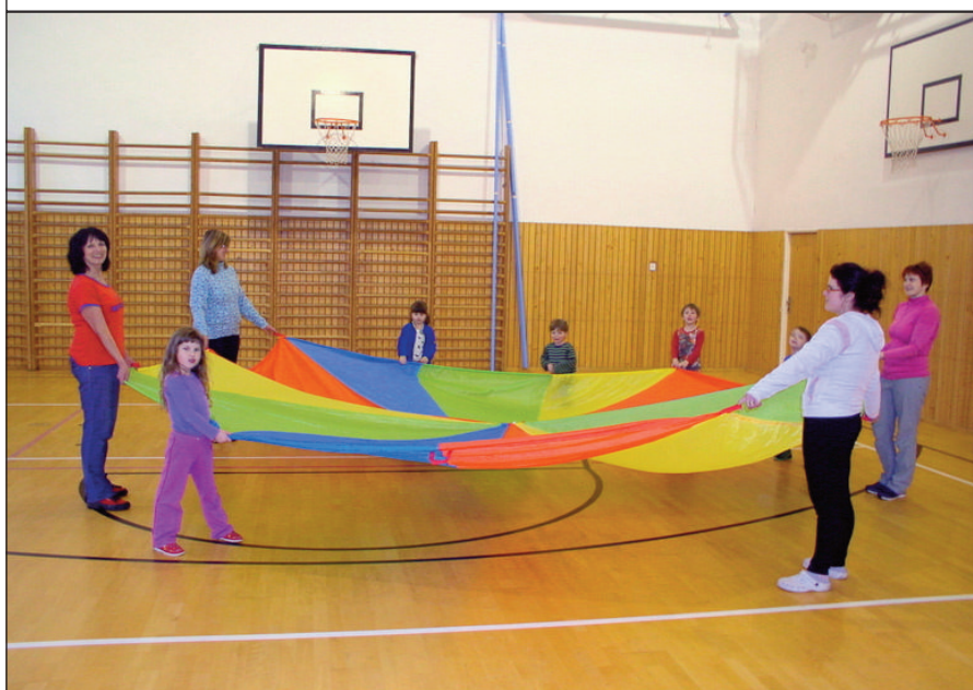
Oddíl Rodiče a děti

zorganizujeme pro ně několik plavání, her v přírodě, turnajů. Na konci roku se mohou těšit za svoji aktivní účast na drobné odměny, diplomy a ceny při slavnostním zakončení hry.