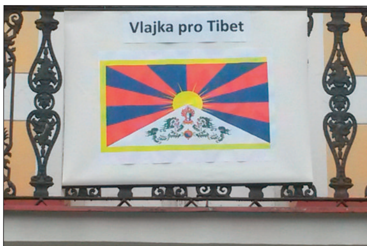
Obecní úřad ve Čkyni letos poprvé vyvěsil "Vlajku pro Tibet" na připomenutí 57. výročí povstání Tibetanů proti čínské okupaci. (OÚ)