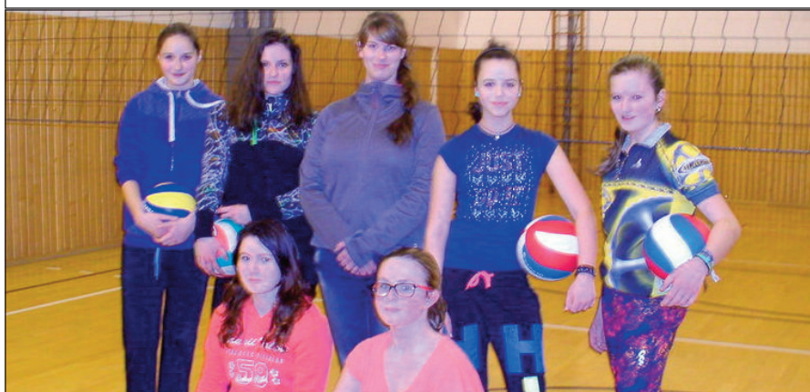
Odbíjená – starší žákyně

se hezky sehrají a zápas zvládnou. V příštím roce některé odejdou na školy, kde mohou pokračovat ve studentských oddílech, přesto v nich vidím už nyní budoucnost našeho čkyňského ženského volejbalu v letech příštích. Takže dívky od 7. třídy, neváhejte a v novém školním roce přijďte mezi nás!