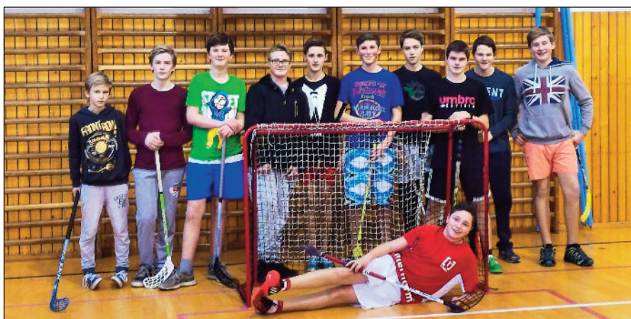
Florbal – žáci

Odbíjená starších žákyň funguje již druhým rokem. Oddíl je především pro začátečníky, děvčata se zpočátku roku učí techniku odbíjení prsty a bagrem. V průběhu roku se přidává nácvik podávání, nahrávky, smeče, technika a strategie hry ... K vlastní hře se dívky dostávají téměř až po roce, je tudíž nutná trpělivost a hlavně chuť vytrvat a chtít se volejbal naučit. V současnosti máme sedm děvčat, které se intenzivně odbíjené věnují, na jejich hře jsou již patrné velké pokroky. Jejich radost ze hry a snaha naučit se volejbal hrát je pro mě tou největší odměnou. Mohou se v budoucnu těšit na první menší turnaj například s děvčaty z Vimperka, který se chystáme zorganizovat v závěru cvičebního roku. Jelikož jsou naše mladé volejbalistky moc šikovné, věřím, že