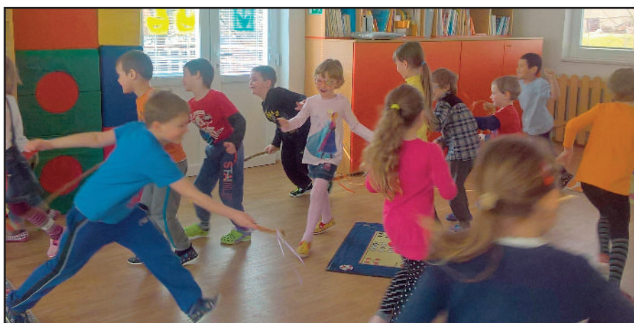
Velikonoce ve školce: Ve školce poctivě dodržují velikonoční tradice a tak mohli kluci řádně vyšupat všechny holčičky

Ale nežli jim v září každodenní povinnosti nastanou, čeká je zápis do první třídy. Některé se těší více, jiné méně a některé ještě méně. Tuší, že všem, a to nejen dětem, ale také rodičům nastanou povinnosti. Zápis je taková zkouška toho, do jaké míry už jsou děti samostatné, co všechno dovedou, co si pamatují, jak reagují. Každá ze základních škol připravuje zápis trochu jinak, ale v podstatě obsahuje stejné úkoly. Úkoly směřující