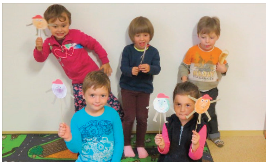
Vyrábění papírového koblížka

Těšíme se na Vás v prosinci a přejeme hezký advent. Váš KOS