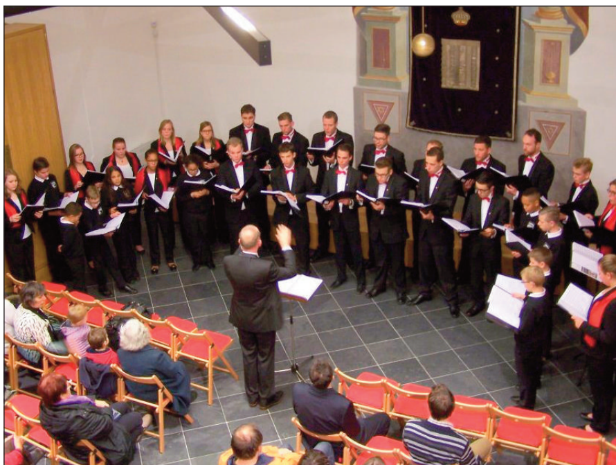
Holandský sbor v synagoze posluchače okouznil