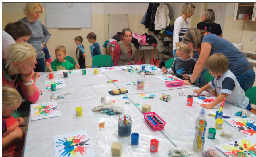
Malování prstovými barvami