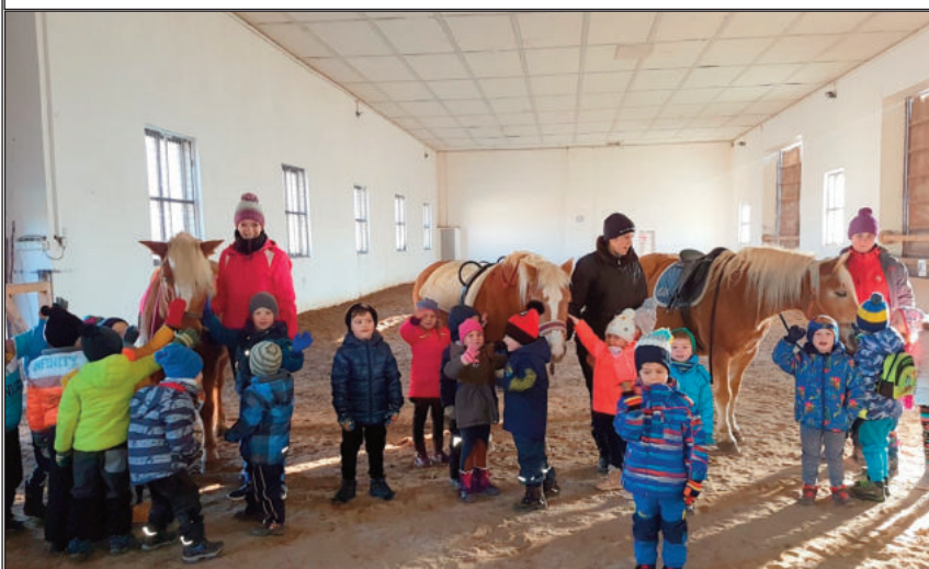
Děti vítaly sv. Martina v jízdárně v Bohumilicích