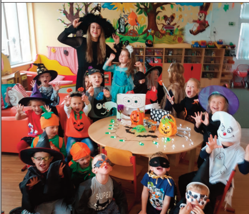
Strašidelný Halloween ve druhé třídě