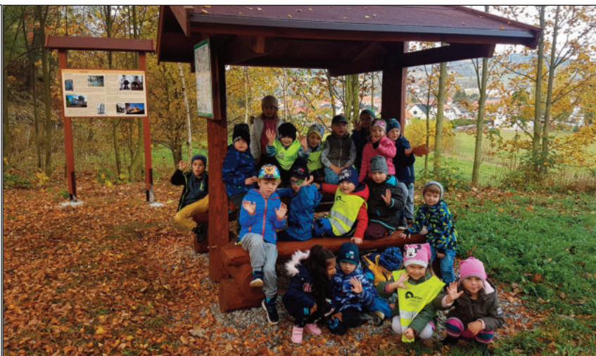
Den stromů končil u nového posezení pod židovským hřbitovem