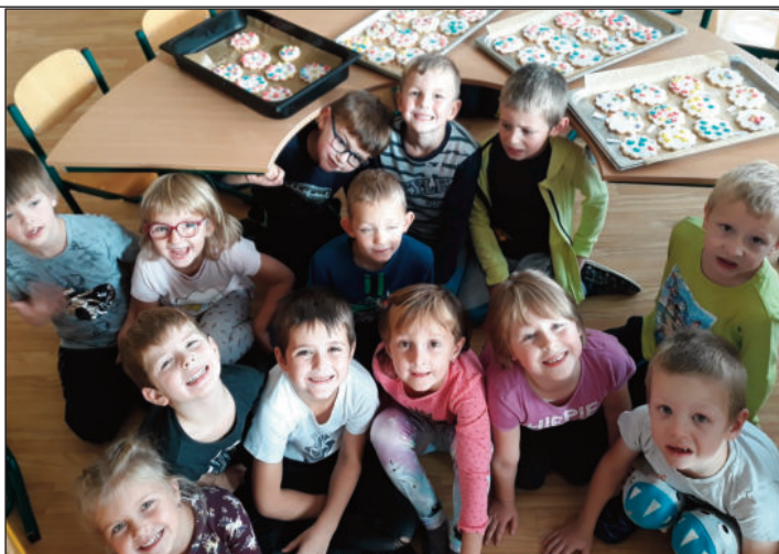
Prožitkové učení – pečení hnětýnek

Držme si palce, snad už se blýská na lepší časy. Všem přežeme klidné, šťastné a hlavně ve zdraví prožité Vánoce. A nejen je. V. Pechoušková