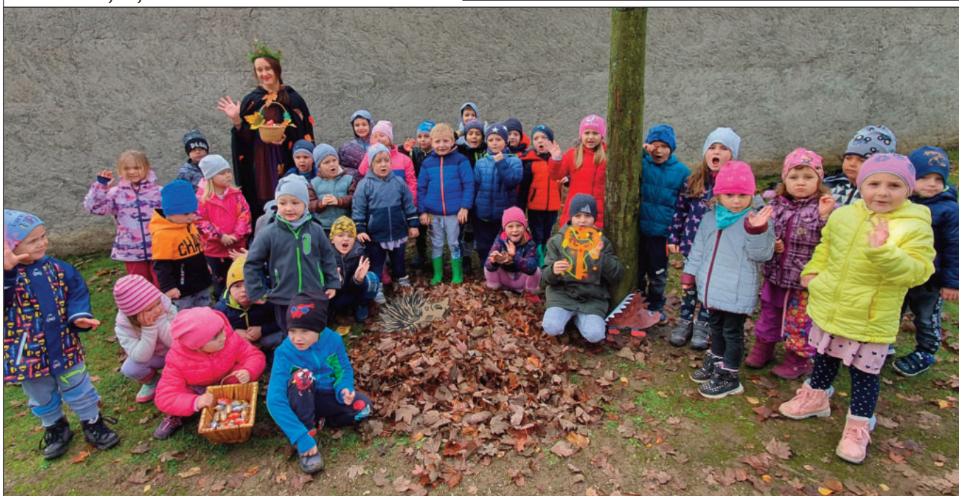
Zamykání školní zahrady s vílou Podzimničkou