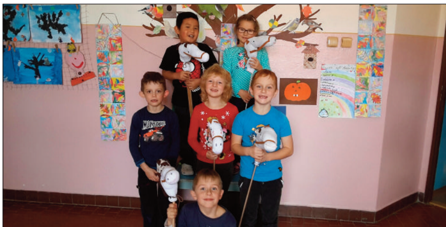
Děti z družiny s vlastnoručně vyrobenými bělouši vítali sv. Martina

Žáci devítky si vybírají střední školu. V dubnu je čekají přijímací zkoušky. Zatím hledají informace o jednotlivých školách, mohou se jet podívat na dny otevřených dveří, prohlédnout si webové stránky. Burzu škol jsme měli i u nás, představilo se 11 okolních středních škol, dotazů bylo hodně.