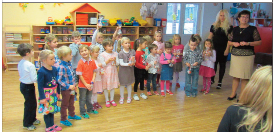
Děti ze 2. a 3. třídy si na sobotní oslavu připravily vystoupení