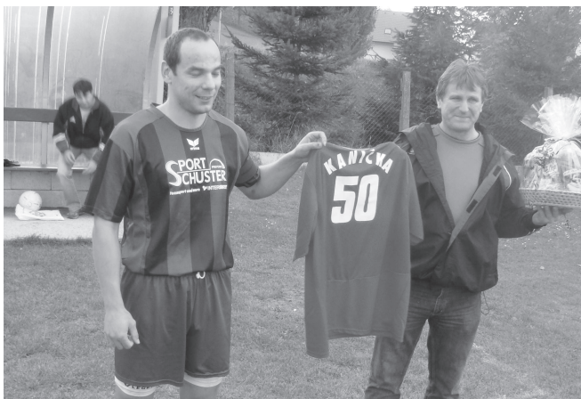
Všechno nejlepší, předsedo!