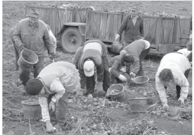
Čkyňští úderníci při sběru brambor

V zemědělském družstvu AZ Delta pracuje dnes 45 lidí, z nichž ta větší část se věnuje rostlinné výrobě. Příčinou vyšší sklizně je podle vedení také nákup nové techniky, kterou je možné pořídit hlavně díky dotacím poskytovaným Evropskou unií. Během posledních pěti let nakoupila společnost