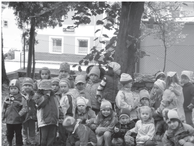
Nová generace čkyňských dětí u Lípy svobody

A tak jsme diskutovali. Oni: U vas kontrarevoljucija! Já: Tady žádná kontrarevoluce není. Vidíte ji někde? Oni: Ty kontrarevoljucioněr! Máš motorku, černé brýle, americké kalhoty (tím mysleli džíny) a koženou bundu. Jsi typický kontrarevolucioněr! Plynul čas a téma diskuze se měnilo. Já: Proč jste zavřeli naše představitele? Oni: Nikoho jsme nezavřeli, to je lež! A jeden voják, který jen tak koukal, najednou řekl: Da, éto právda. Oni byli v tjúrmě v Lvově. A už ho vedli, už nediskutoval. Odpoledne mě pustili. Otočil jsem to a jel domů. Padla na mě tíseň. Na ně neplatí