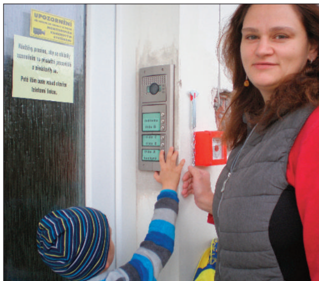
Školka má nové elektronické zabezpečení dveří

s kamerovým systémem. Jsou zabezpečeny jak oba pavilony s třídami, tak i hospodářský pavilon. Každá třída, kuchyně a ředitelna mají svůj zvonek, všechny návštěvy jsou viděny. To přispívá nejen ke klidnému, ale především bezpečnému chodu mateřské školy.