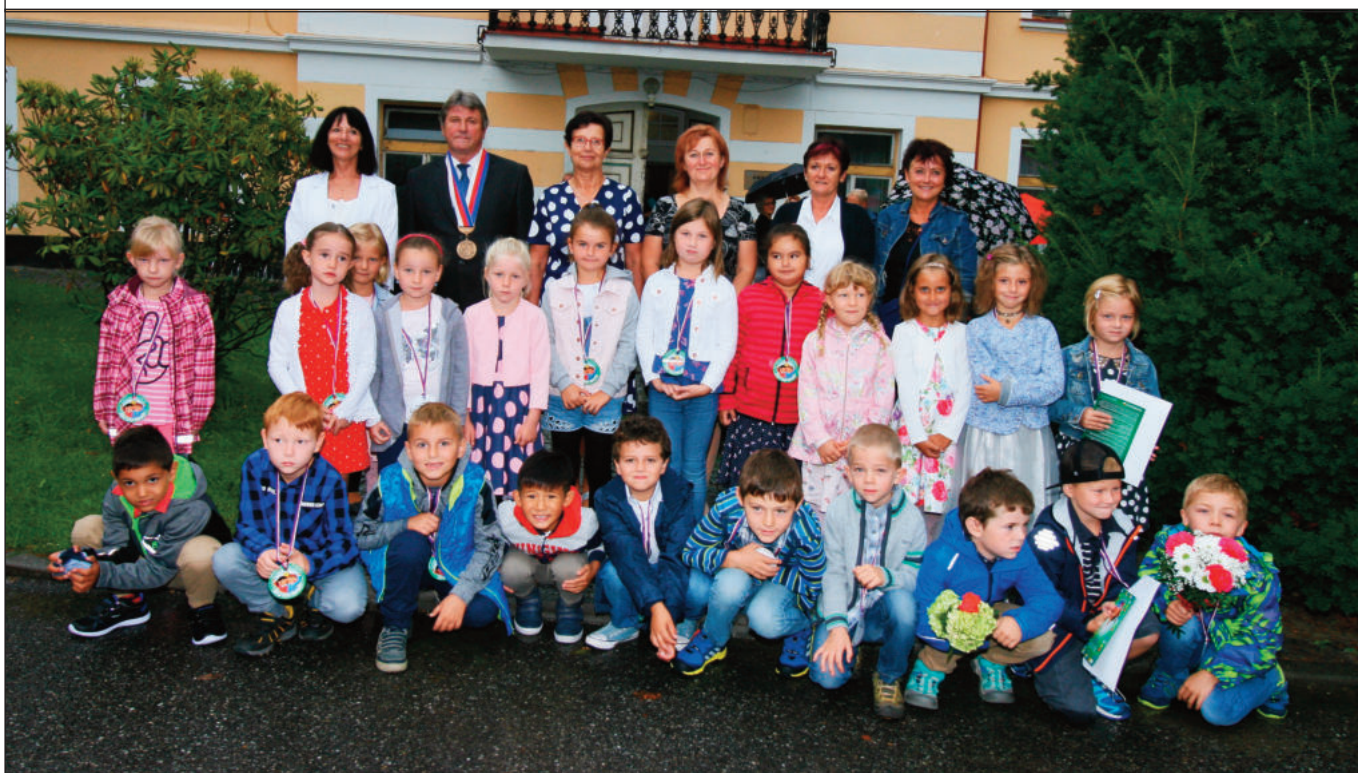
Letošní prvňáčci se rozloučili se svými učitelkami ze školky tradičně na obecním úřadě