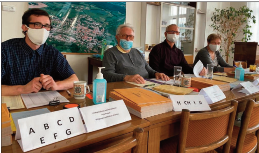
Volební komise i volby se musely přizpůsobit pandemii koronaviru

Vítězem voleb do zastupitelstev Jihočeského krajského úřadu se ve Čkyni stalo hnutí STAN (Starostové a nezávislí) se ziskem 20,77 procenta. Volilo 474 lidí z 1278 možných voličů. Druhá ODS měla téměř 18 procent. Třetí ANO 2011 volilo 64 lidí, což v celkovém součtu představuje 13,85 procenta. Čtvrtí pak byli Piráti - 12 procent. O dvě procenta méně získala koalice TOP 09 a KDU/ČSL. K volebním urnám přišlo o necelá tři procenta lidí více než před čtyřmi lety, kdy se konaly poslední krajské volby. Tehdy ve Čkyni volby vyhrála ČSSD