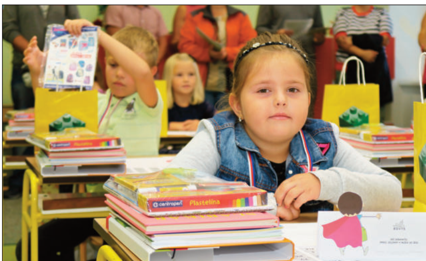
Poprvé ve školní lavici