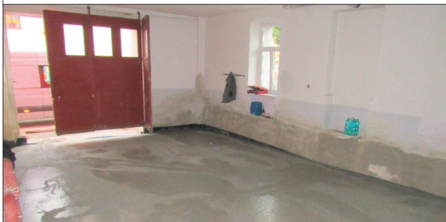
Ze staré garáže vyvozili hasiči 80 tun betonu a zeminy