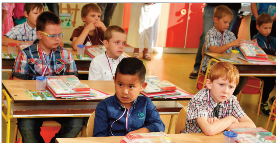
Poprvé ve školních lavicích

Děti dostávají čip, kterým se otvírá škola, skříňka i odebírá oběd. Tři v jednom. Nastávají nové povinnosti, děti se učí zodpovědnosti a samostatnosti. Loni jsme se radovali nad novou šatnou vybavenou skříňkami, po kterých jsme dlouho toužili. Přáli jsme si vyhodit do sběru ty staré drátěné klece, rozsvítit šatnu. Vylepšit tak první krok po ránu do školy. Chtěli jsme dopřát žákům místečko, kam si mohou odkládat své věci, uklidit cvičební úbor, noty na odpolední hudebku,