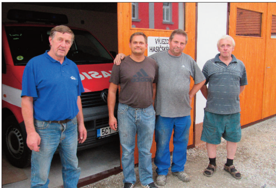
Někteří z pracovitých hasičů před novou dvougaráží