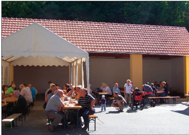
Na návštěvníky parku u OÚ čekalo příjemné posezení v nově zrekonstruovaných prostorech