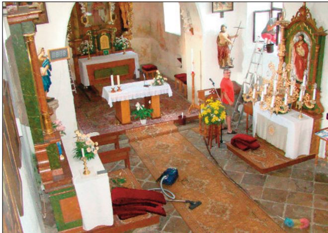
Před poutí se gruntovalo i v kostele sv. Máří Magdalény

Třetí červencový víkend patřil čkyňské pouti. Jedná se o jeden z nejočekávanějších víkendů v roce, na který se připravuje nejen zdejší obecní úřad, farnost či spolky a sdružení, ale téměř všechny rodiny. Poutovní návštěvníci letos nejvíce ocenili nově opravenou budovu stojící vedle obecního úřadu. Ta najde využití během celého roku, kdy zde bude možné hledat úkryt před deštěm, větrem i sluncem.