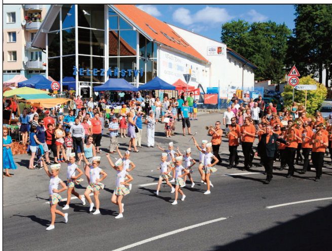
Neděli zpestřilo vystoupení vimperských mažoretek a dechovky