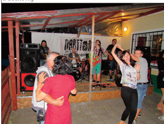
O zábavu během pouti se postaralo několik hudebních skupin. V sobotu večer v hospodě Na hřišti zahrála kapela NABETON.