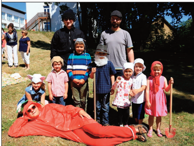
O velké řepě – tak se jmenovala pohádka, kterou členové KOS v neděli dvakrát úspěšně sehráli v zahradě u OÚ. V představení si zahráli děti i dospělí z publika.