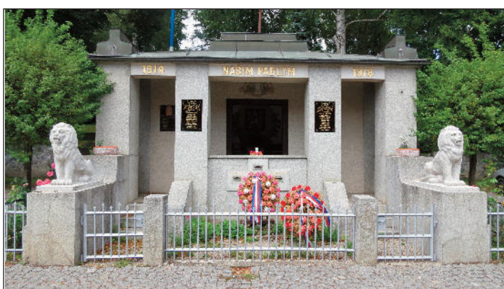
Pomník padlých prošel částečnou renovací zvenku i zevnitř, další opravy ho ještě čekají