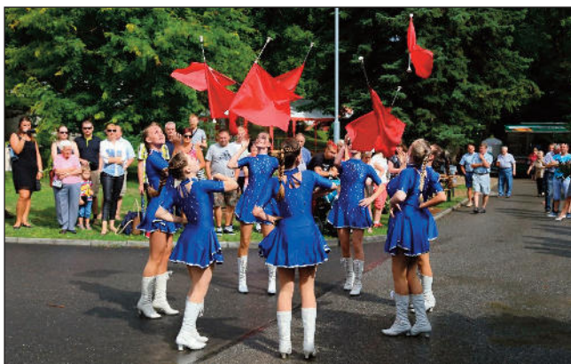
Pout' zpestřilo tradiční vystoupení vimperských mažoretetek