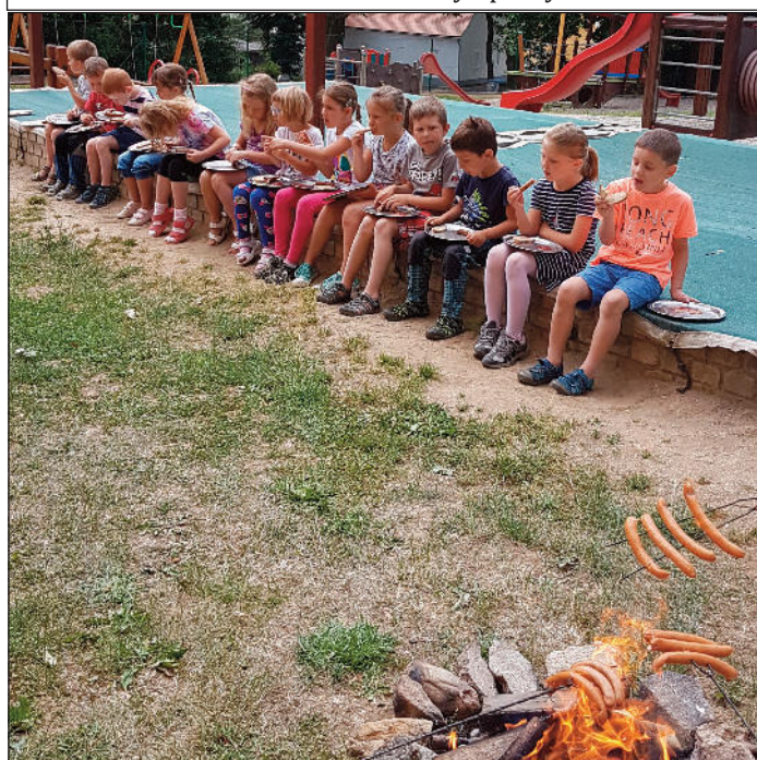
Opékání párků na konci školního roku