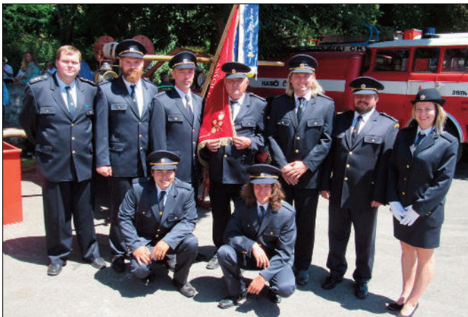
Kolegové hasiči z Horosedel