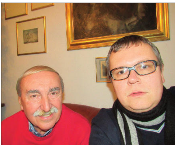
S brankářem Jirkou Holečkem v jeho bytě u motolské nemocnice