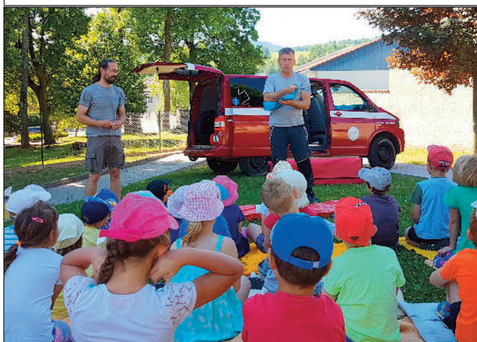
Návštěva Informační a strážní služby Správy NP Šumava