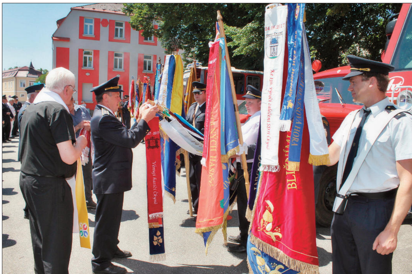
Stužkování a svěcení praporů