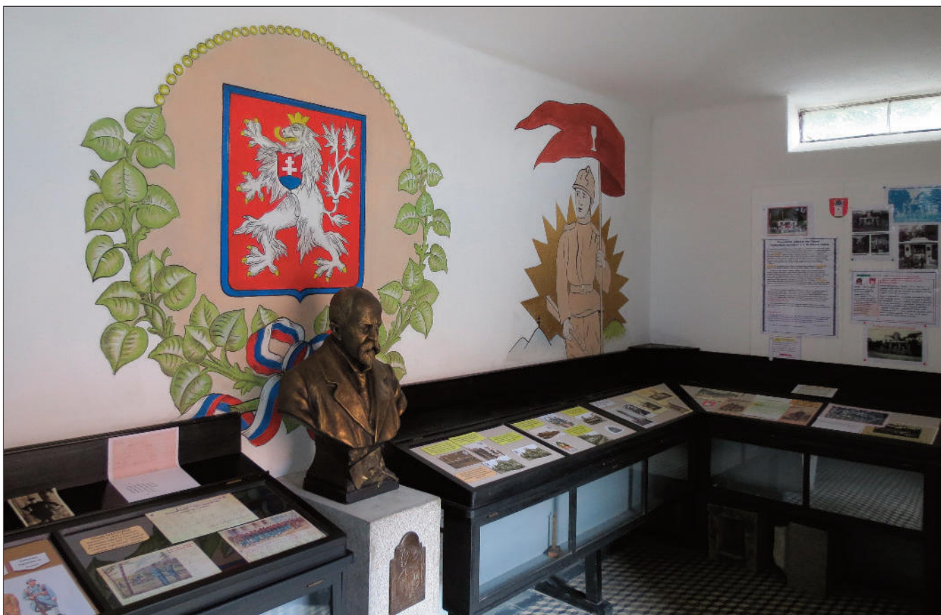
Krásně zrestaurované vzpomínkové místnosti v pomníku padlých vévodí původní busta T. G. Masaryka