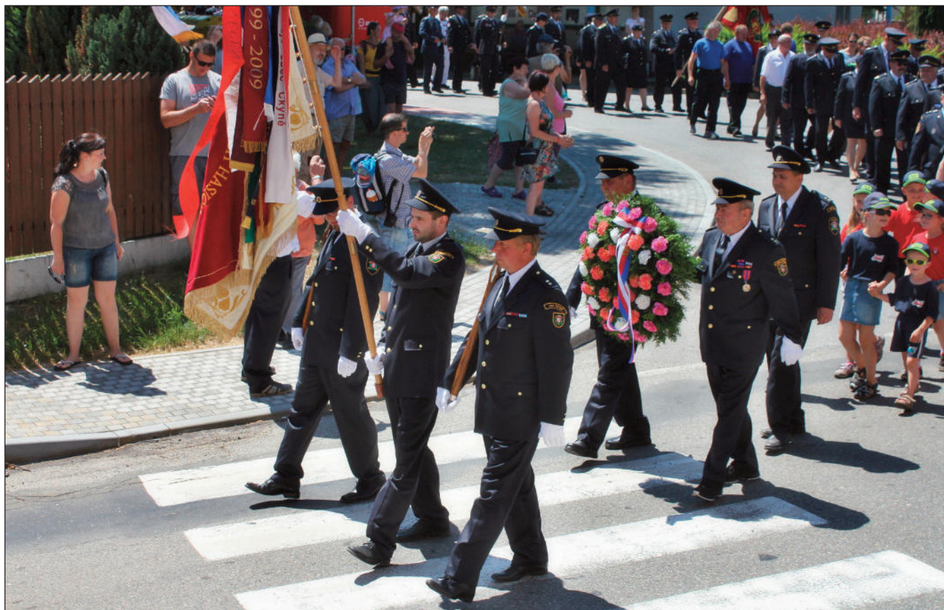
Slavnostní průvod hasičských sborů