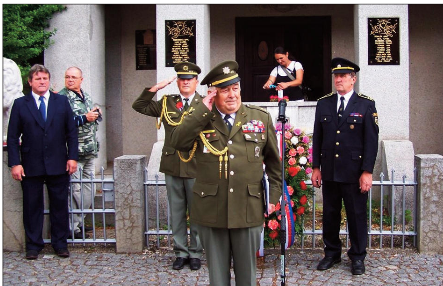
Vzpomínková slavnost u pomníku padlých

Pro dokreslení tehdejší situace na frontě předkládáme úryvek z válečného deníku, do kterého patrně nějaký prostý čkyňský rakousko-uherský voják zapisoval svoje drsné zážitky z roku 1917. Originál je uložen v památníku padlých.