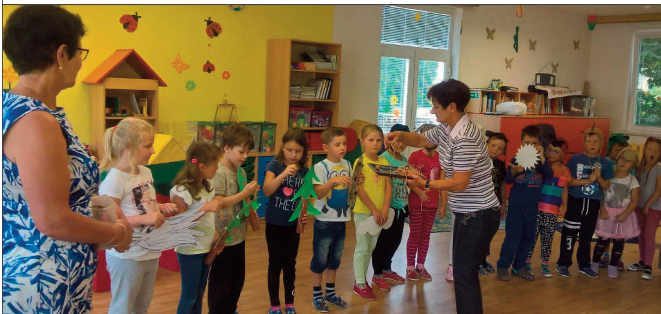
Předškoláci nacvičili pohádku a dostali na rozloučení zvonečky