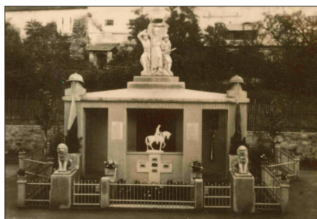
Původní podoba pomníku