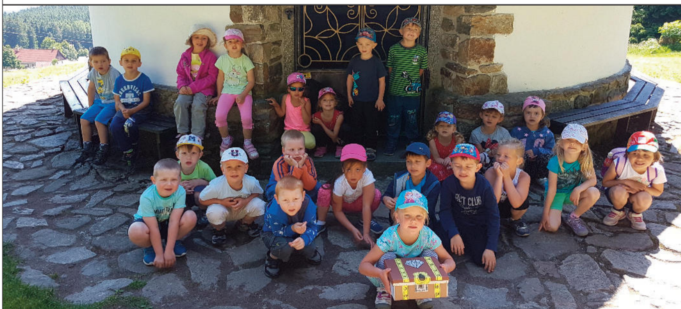
Děti z druhé třídy na výletě na Javorníku