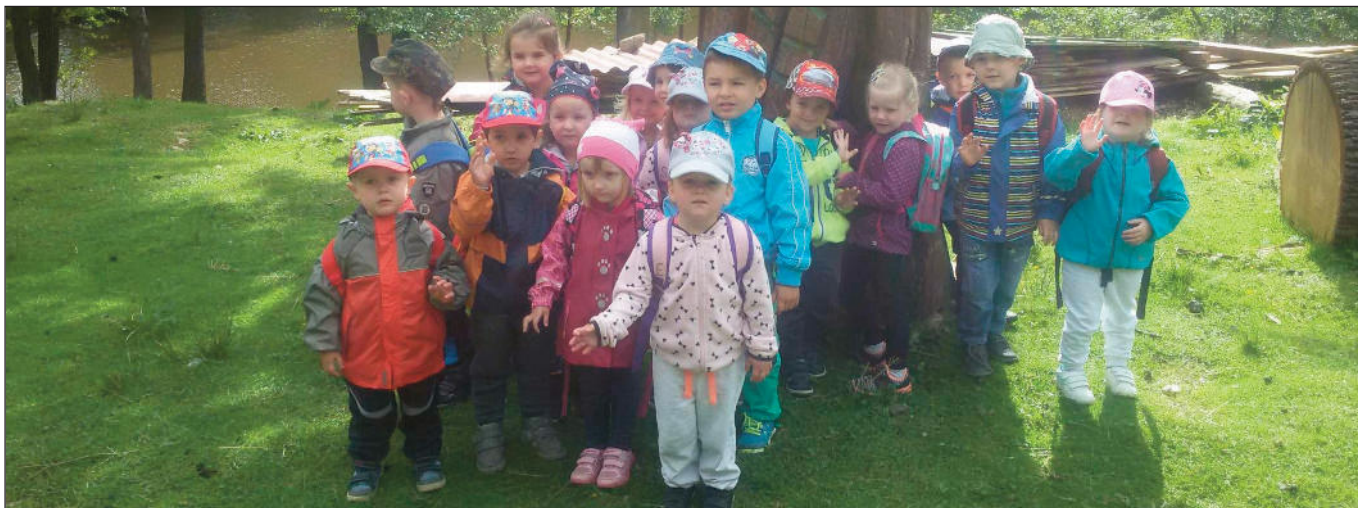
Děti z první třídy na výletě u Feferského rybníku