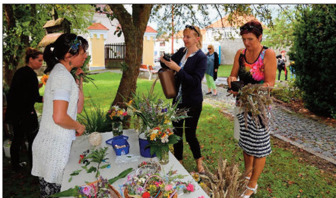
Letos nechyběl ani oblíbený květinový stánek KOS