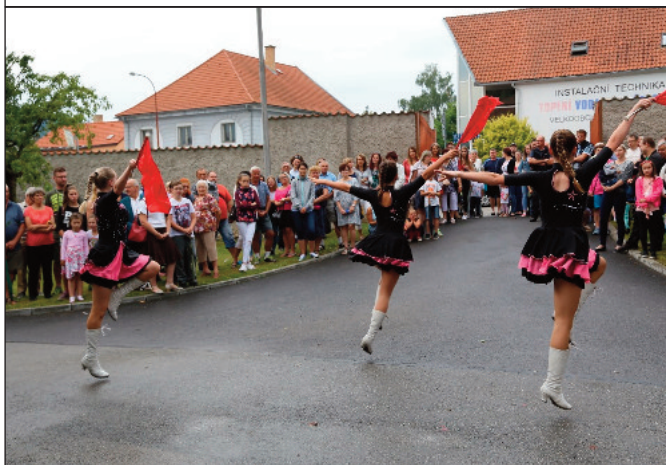
Nechybělo tradiční vystoupení vimperských mažorettek