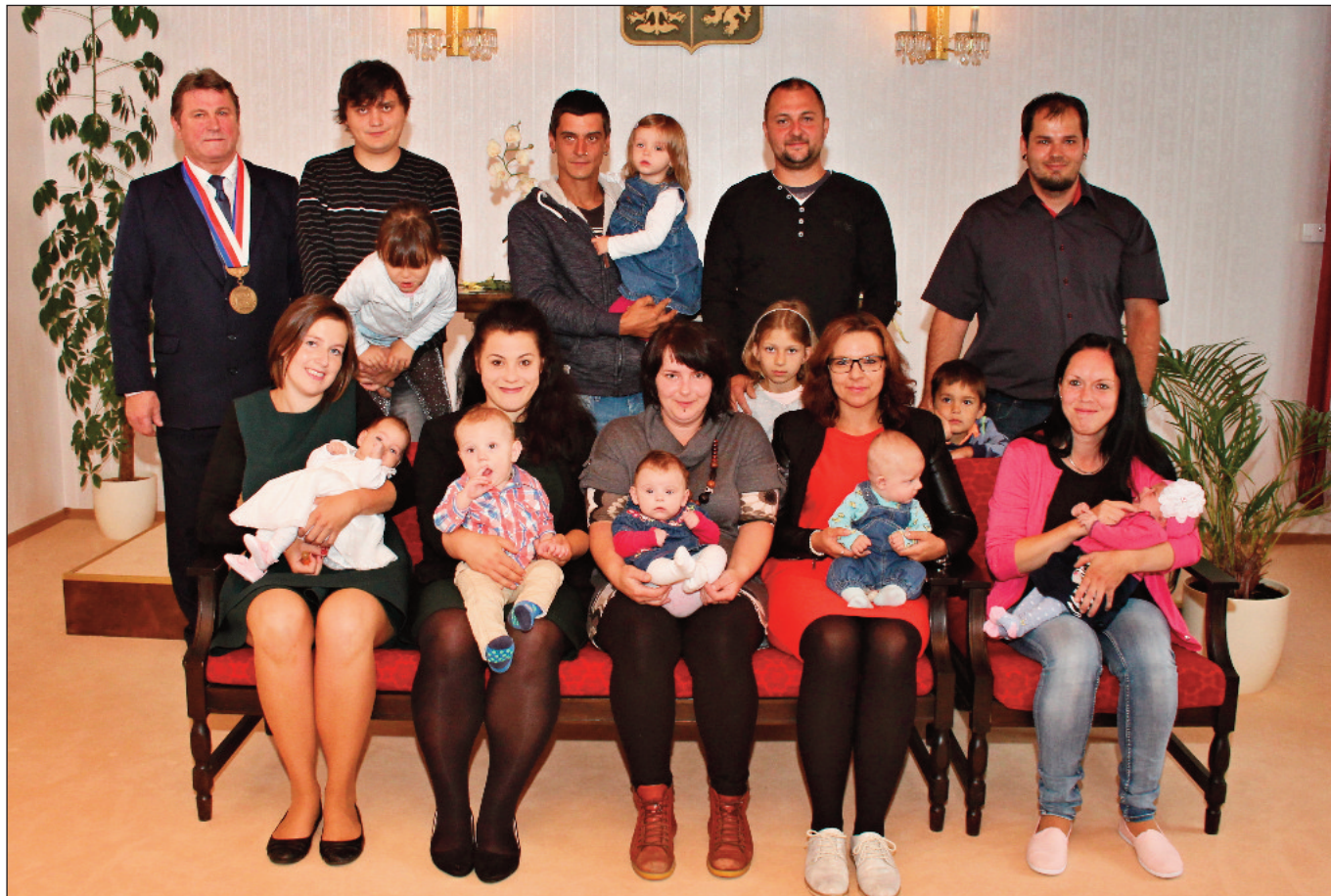
Vítání občánek 23. 6. 2018