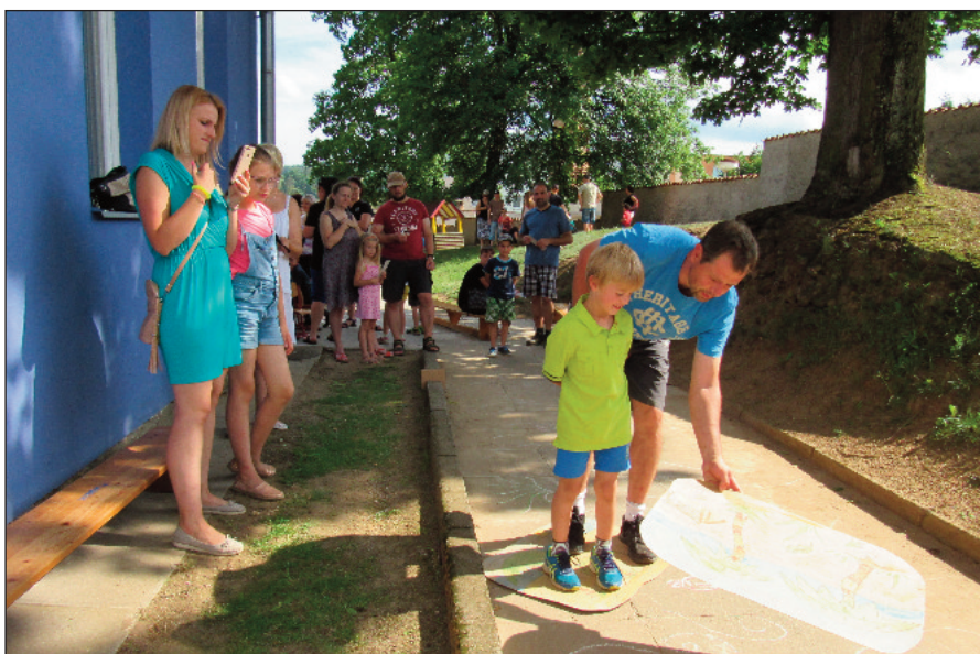
Den otců byl plný veselých úkolů