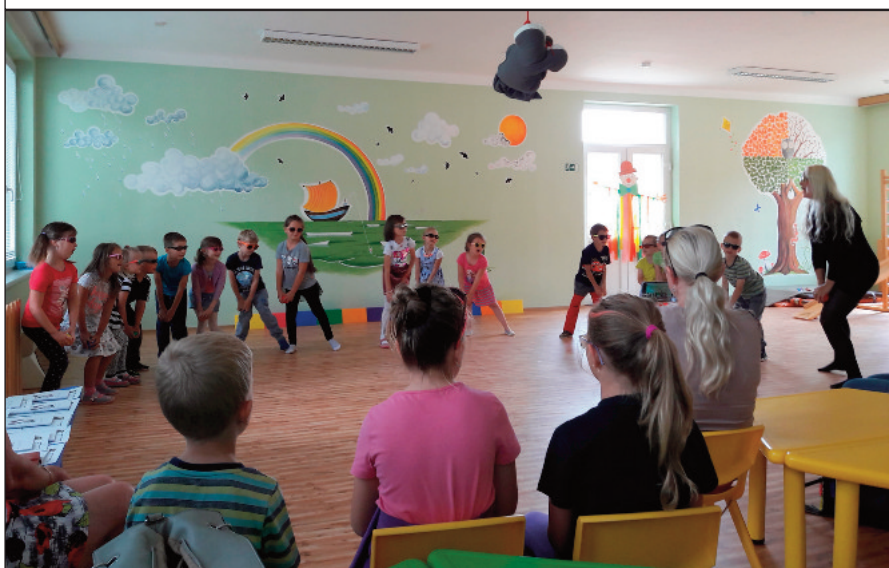
Děti předvedly rodičům, co se naučily na kroužku angličtiny