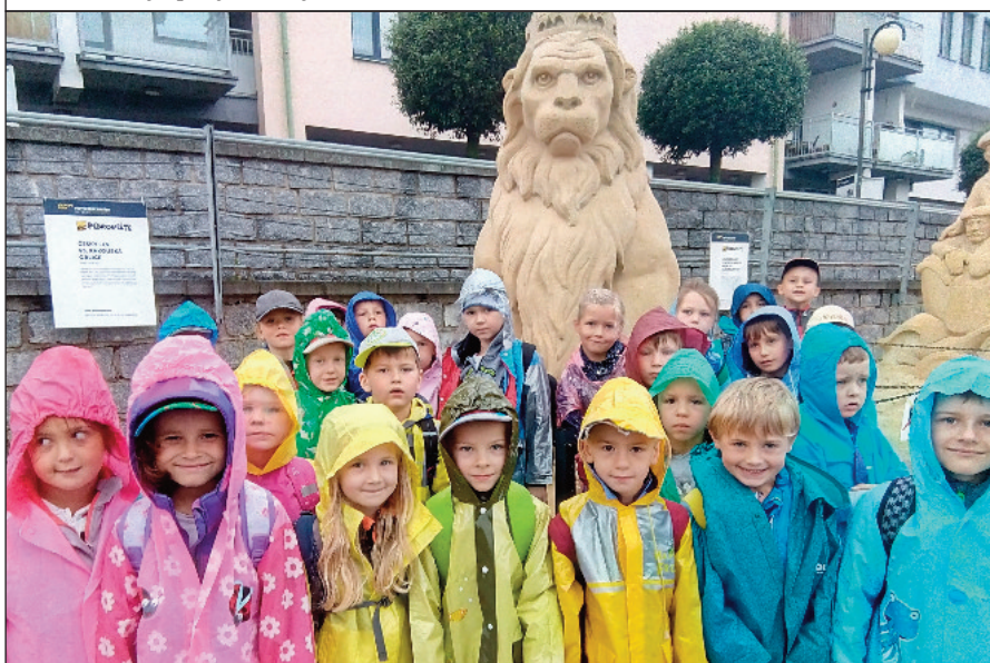
Výlet do Písku nezkazilo ani deštivé počasí