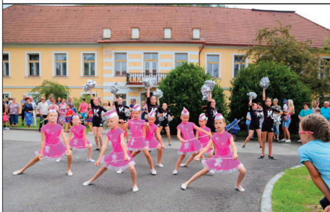
Tradiční vystoupení vimperských mažoretek

Stejně jako každý rok si během poutových veselí museli přijít na své téměř všichni. Mladí, staří, milovníci fotbalu, divadla, ohňových show, dechovky i rockové muziky a hlavně naši nejmenší. (pp)