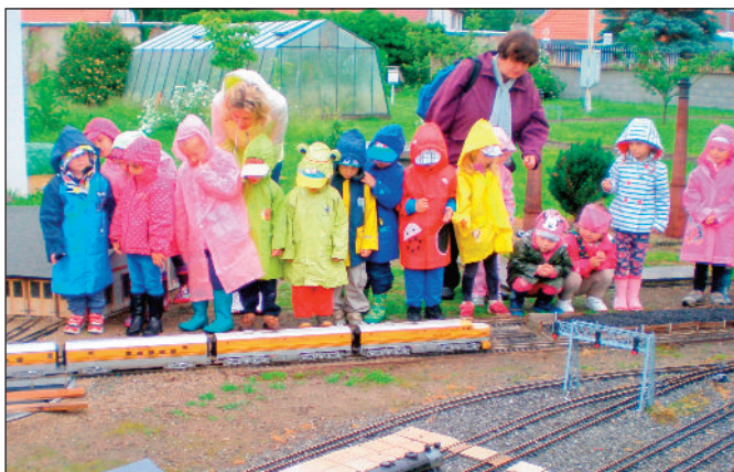
Výlet 1. třídy do „muzea vláčků“ v Husinci