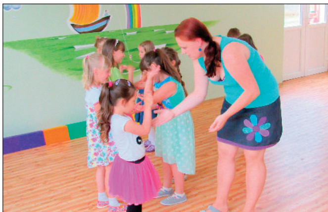
Závěrečné vystoupení kroužku Tanečky