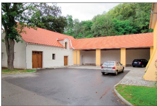
Poutové veselí se konalo v nově opravených prostorech u obecního úřadu