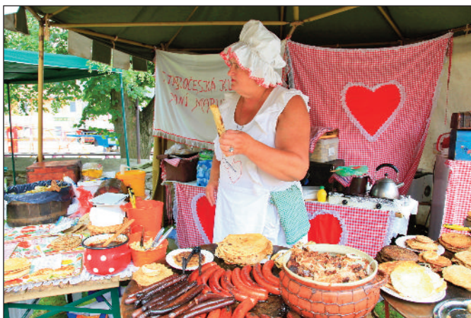
Pout' zpestřil stánek s dobrotami ve staročeském stylu