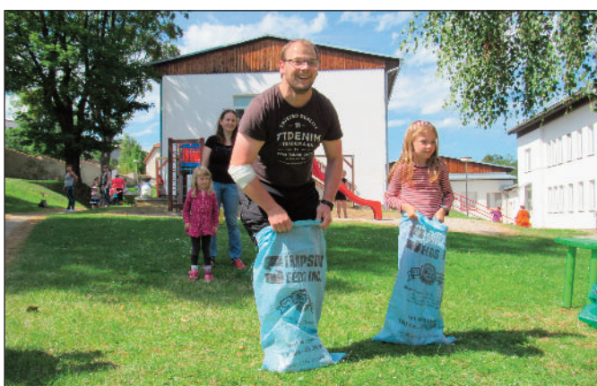
Den otců na zahradě MŠ