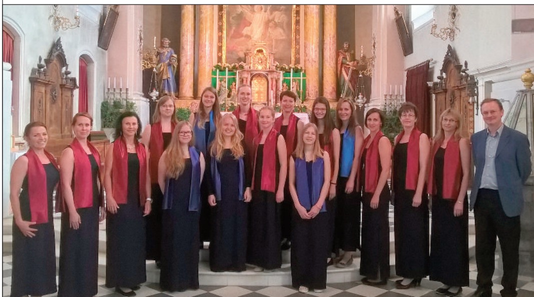
Kostel S. Stefano ve Villabassa

Účastí na tomto festivalu jsme kromě zážitků a inspirace získaly i nové kontakty s některými sbory z Čech i ze zahraničí. Rády bychom poděkovaly za podporu Obci Čkyně a ZŠ a MŠ Čkyně, že jsme mohly důstojně reprezentovat Českou republiku v zahraničí.