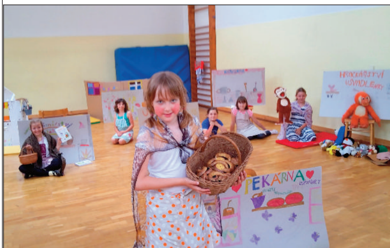
Pohádka Hora Lenora