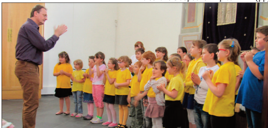
Závěrečné vystoupení Růžiček v synagoze

Tento rok bychom měli pořádat 12. Festival dětských pěveckých sborů. Dále nás čekají vánoční koncerty, jeden zajímavý projekt připravuje dětský sbor Růže, pak jarní a závěrečný koncert. Rýsuje se pozvání pro Rosettu na větší akci v Hosíně, kde jsme v červnu s úspěchem zpívali. (pp)