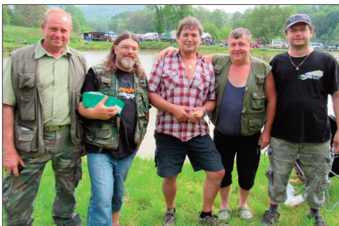
Organizátoři rybářských závodů