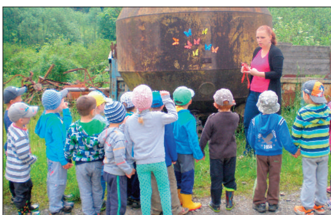
Den dětí - hledání pokladu

Svazek obcí Věneč ve spolupráci s obcí Kubova Huť a obcí Buk pořádají v sobotu 3. září 2016