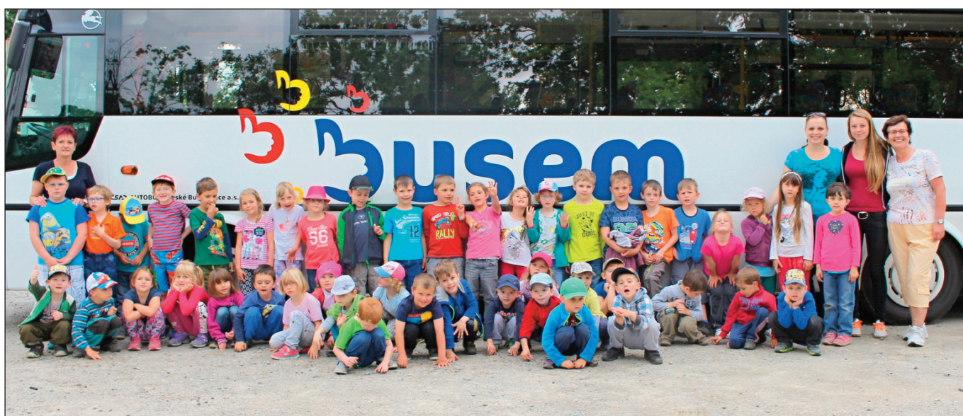
Výlet 2. a 3. třídy do ZOO Hluboká