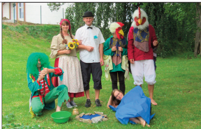
KOS si o letošní pouti připravil pro děti veselou pohádku O kohoutkovi a slepičce