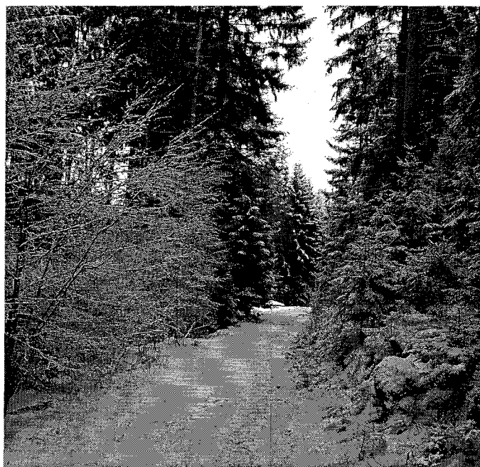
Silvestr na Věnci.

Firma Benx s. r. o. (u vlakového nádraží) nabízí kromě alkoholu a tabákových výrobků i krmné směsi.