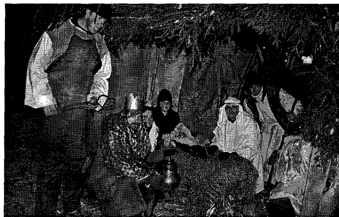
Narodil se Kristus Pán, veselme se.