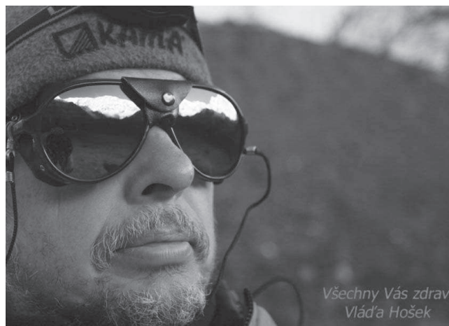
Šumavský vlk pod Annapurnou