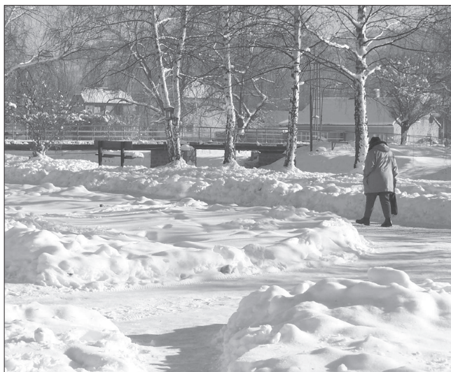
Ladovská zima ve Čkyni