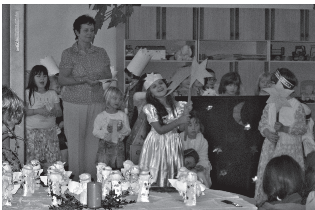
Děti a jejich vánoční příběh