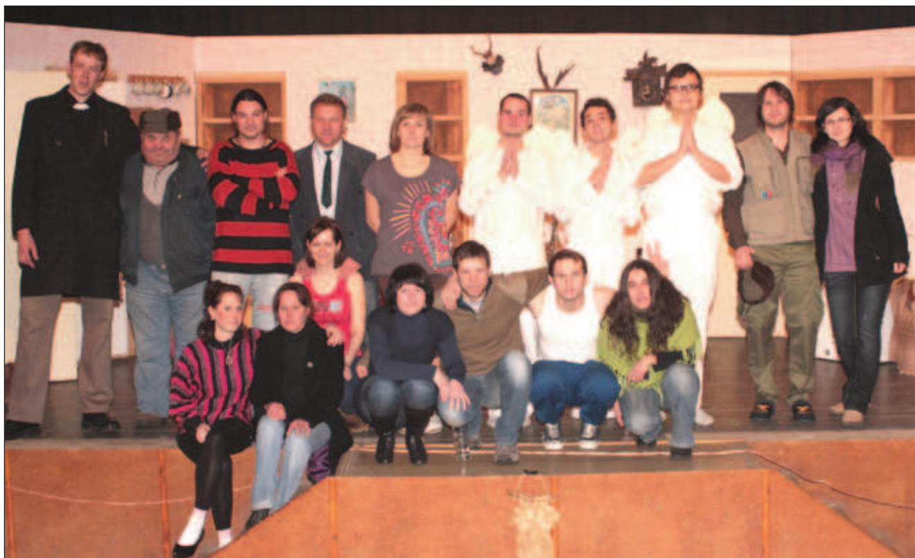
Herecký soubor Kulturního a okrašlovacího spolku Čkyně po premiéře úspěšné hry Postel pro anděla.