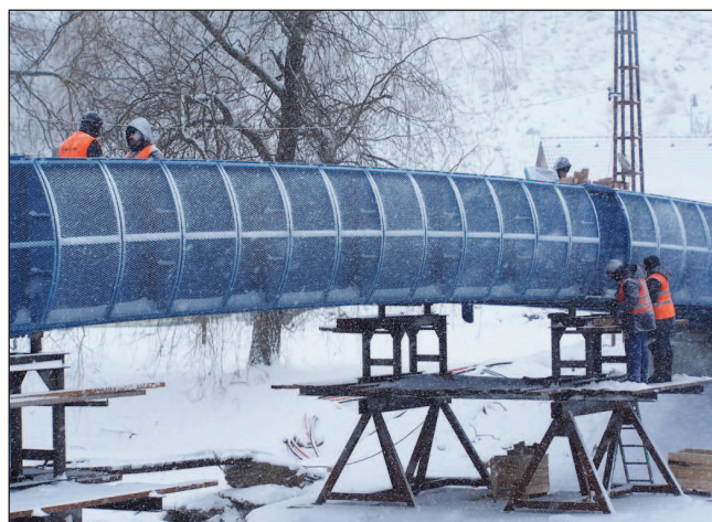
Čkyně má nový most přes řeku Volyňku.

Myslím, že vcelku dobře. Časová náročnost je větší u mého občanského povolání.