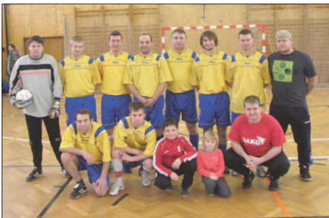
Vítězný tým čkyňských fotbalistů