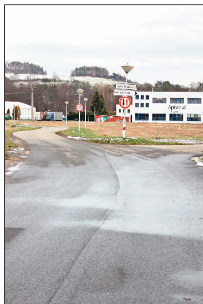
Komunikace od mostu směr KMP