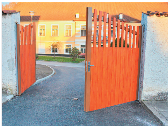
Oprava vrat u obecního úřadu