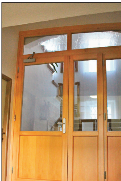
Dveře do obecního úřadu