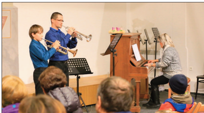
Vánoční koncert žáků ZUŠ ve čkyňské synagoze 17. 12. 2015.