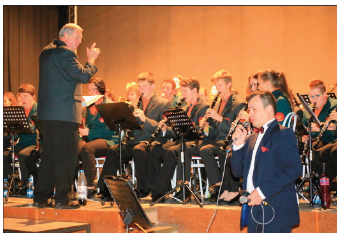
Dne 19. 12. 2015 proběhl ve čkyňském kinosále vánoční koncert ZUŠ Vimperk.