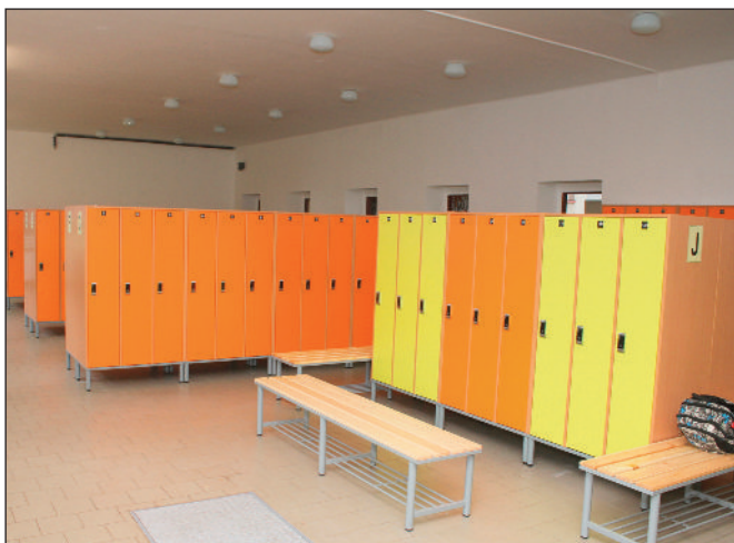
Nové šatnové skříňky v základní škole