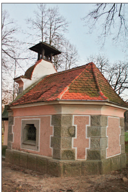
Oprava kapličky ve Zdůlí