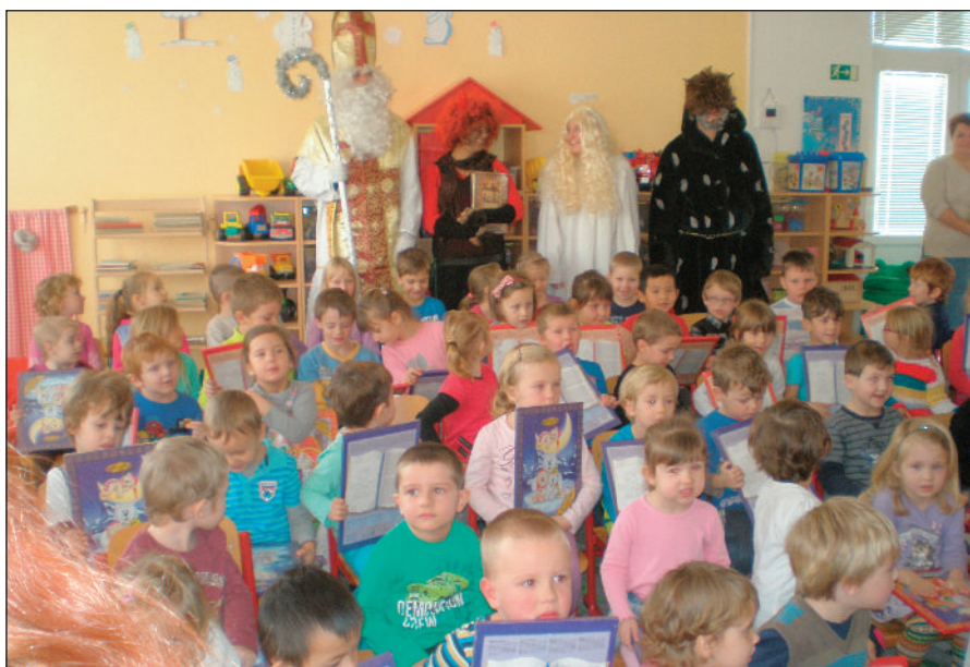
Mikulášská nadílka ve školce