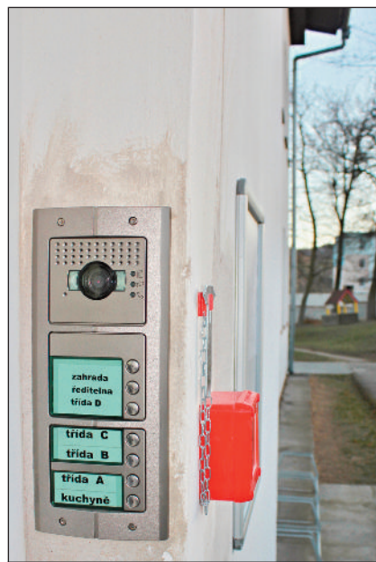
Video vrátný v mateřské škole