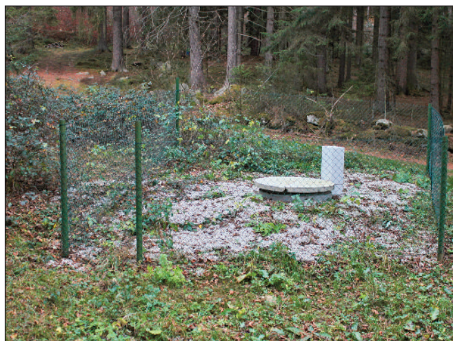
Posílení vodních zdrojů