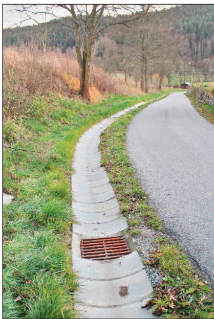
Dešťová kanalizace ve Spůli