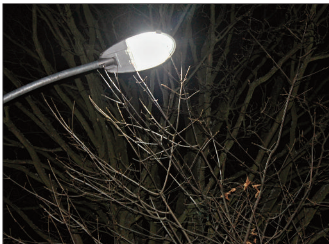
Instalace úsporných svítidel v osadách