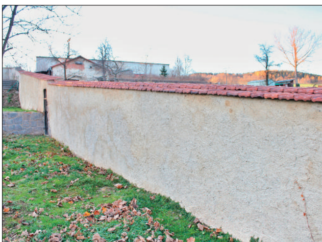
Oprava zdi u mateřské školy