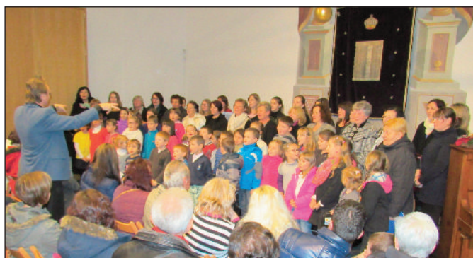
Vánoční koncert čkyňských sborů 11. 12. v synagoze

Ve čkyňském parku bylo v sobotu 5. 12. opravdové peklo. Na děti se tam chystali čerti, kteří na příkaz Lucifera měli pochyťat všechny neposluhy v okolí. Naštěstí se v pravou chvíli objevil Mikuláš s anděly. Nikdo tak peklu nepropadl, ale děti musely Mikulášovi slíbit, že budou poslouchat rodiče, čistit si zuby a jíst obědy ve školce. Mikuláš pak všem hodným dětem rozdál bohatou nadílku. Snad dětem jejich sliby vydrží co nejdéle, protože čert všechno vidí a za rok si všechny děti zase přijde zkontrolovat! Váš KOS