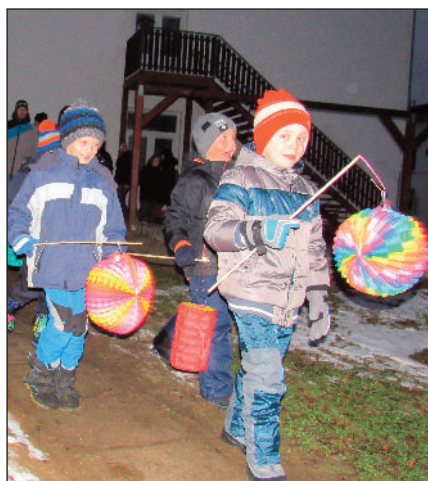
Rozsvěcování vánočního stromku