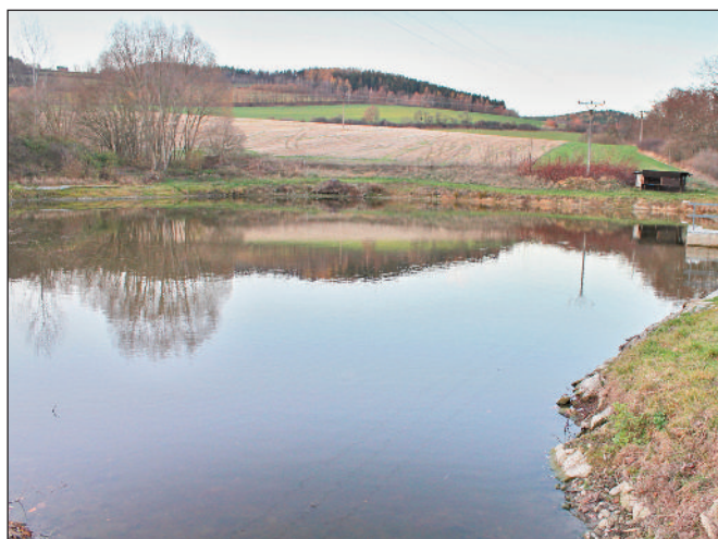
Oprava hráze a vyčištění rybníka ve Čkyni