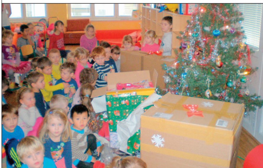
Ježíšek ve školce