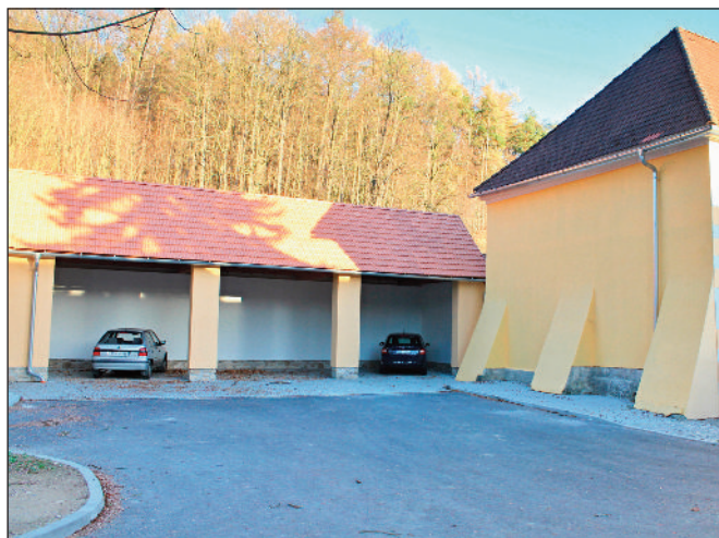
Oprava přístřešku u obecního úřadu