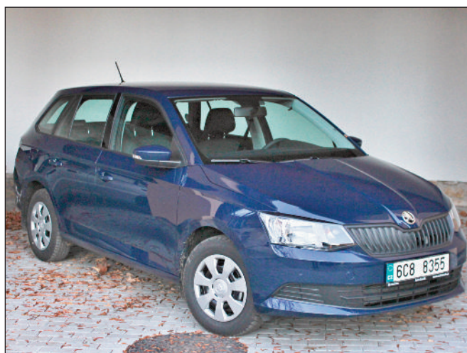
Nový automobil Obce Čkyně