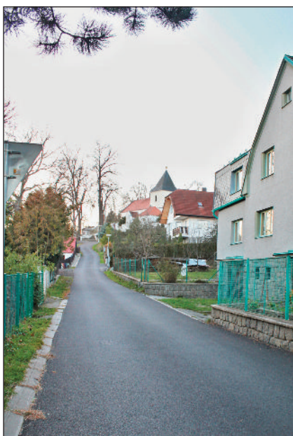
Komunikace ke kostelu