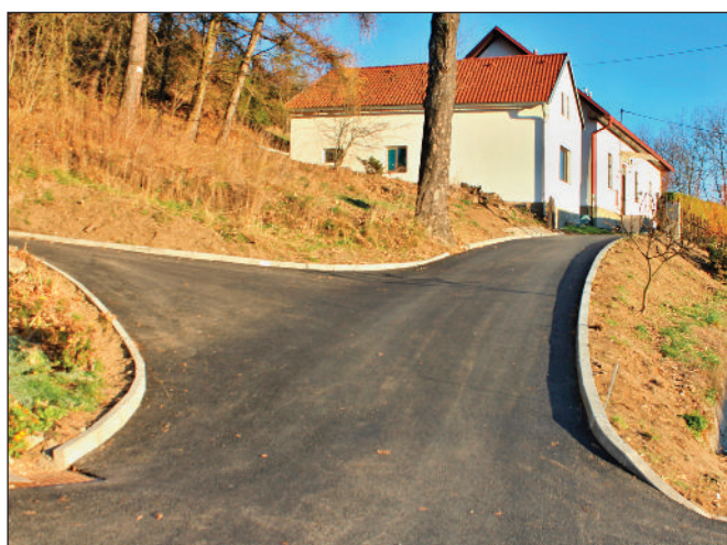
Komunikace k č. p. 50