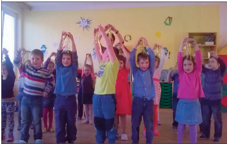
Vánoční besídka 3. třídy