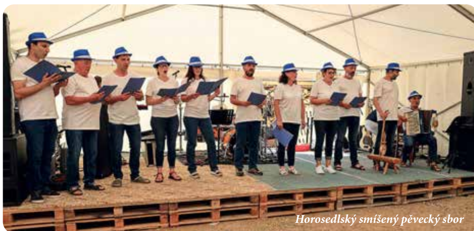
Horosedlský smíšený pěvecký sbor

Obě události byly pro tehdy poměrně lidnatou ves významnými mezníky v historii. Po několika požárech se místní dohodli a na vlastní náklad zakoupili hasičskou stříkačku, postavili hasičskou zbrojnici a vybavili ji potřebným náčiním. Zároveň místo původní dřevěné kapličky postavili novou zděnou a do zvonice osadili původní zvon z roku 1801. Takto významné výročí bylo potřeba důstojně připomenout a oslavit.