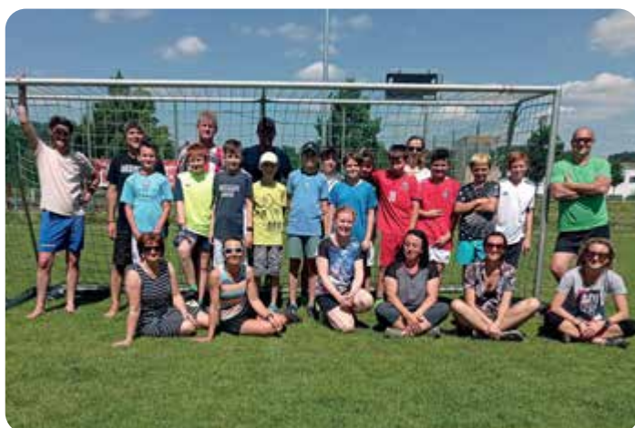
Dokopná 25. 6. 2023.