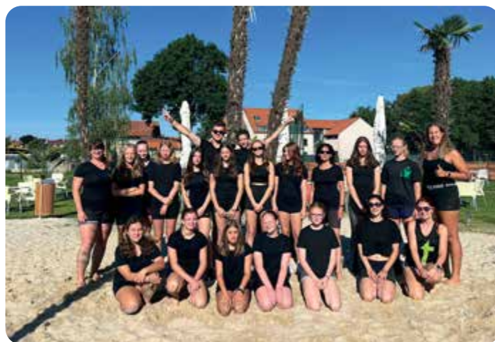
Volejbalové soustředění v areálu Blanice ve Vodňanech.