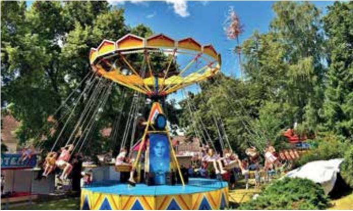
Pouť ve Čkyni se konala na konci července 2023.