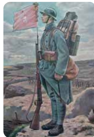
Příslušník československé legie ve Francii

V poválečných letech Novák významně přispěl ke zdokumentování a přesnému výkladu událostí při národní revoluci v květnu 1945 a o úloze partyzánských skupin Niva a Šumava II. Protokolárně vypovídal a postavil se za velitele četnické stanice Aloise Málka jako hrdiny, který 5. května 1945 na náměstí ve Čkyni šel vstříc přesile německých vojáků a jeho statečností nebyly usmrceny desítky čkyňských občanů.