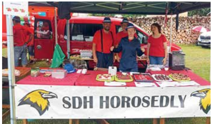
SDH Horosedly se zúčastnilo již tradičně Malinových slavností.