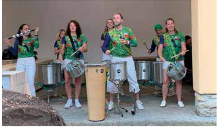
Bubenická show přivítala páteční návštěvníky čkyňské poutě.