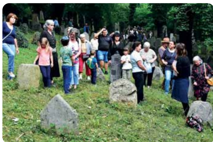
Procházka pro židovském hřbitově ve Čkyni.