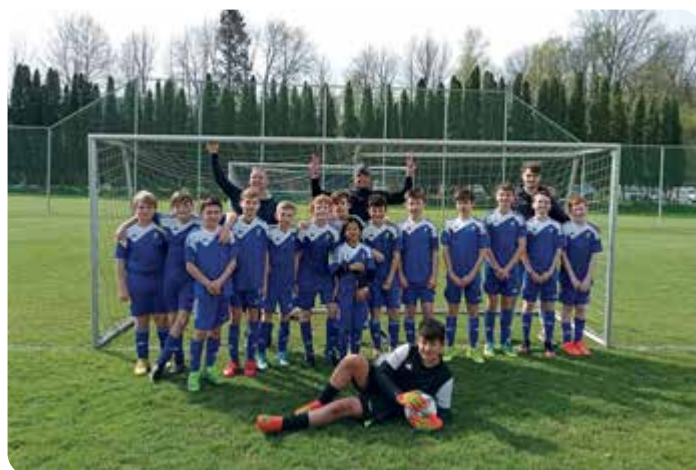
Nyní už se mladí fotbalisté pilně připravují na novou sezónu.