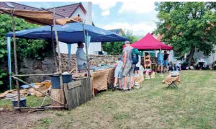
Řemeslný trh v zahradě synagogy o čkyňské pouti.