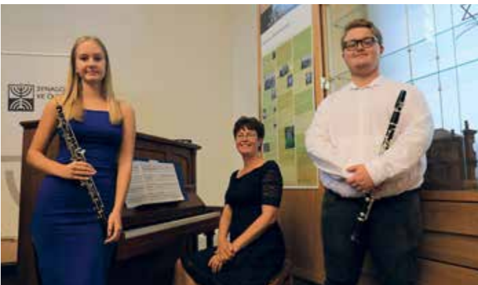
Festivalem Šalom nás provázal hudební doprovod pod vedením p. Zikové.