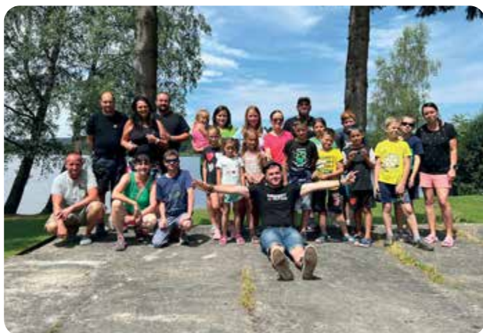
Ze soustředění žactva v kempu Olšina na Lipně.