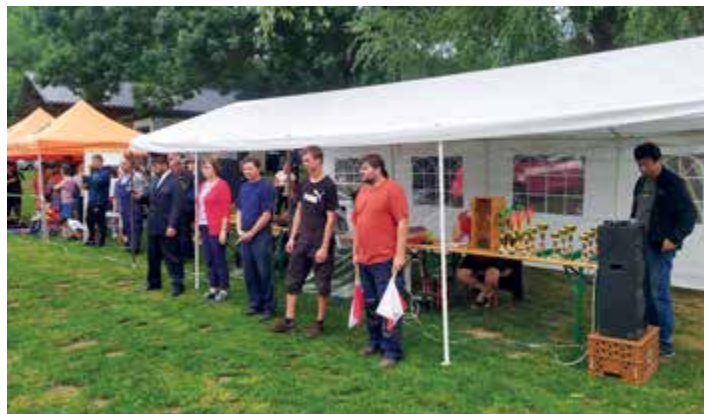
Soutěž o pohár starosty obce v Dolanech.