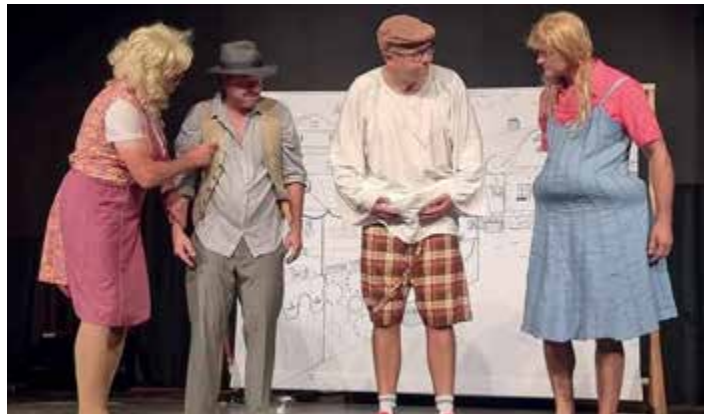
NDC zahrálo v neděli o pouti hru O perníkové chaloupce.