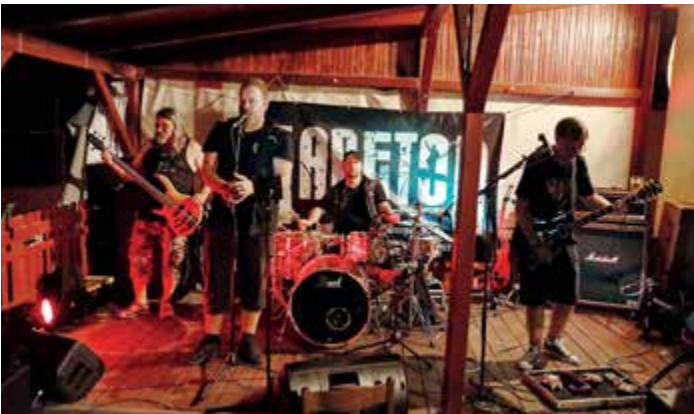
Skupina Nabeton na hřišti v páteční poutňový večer.