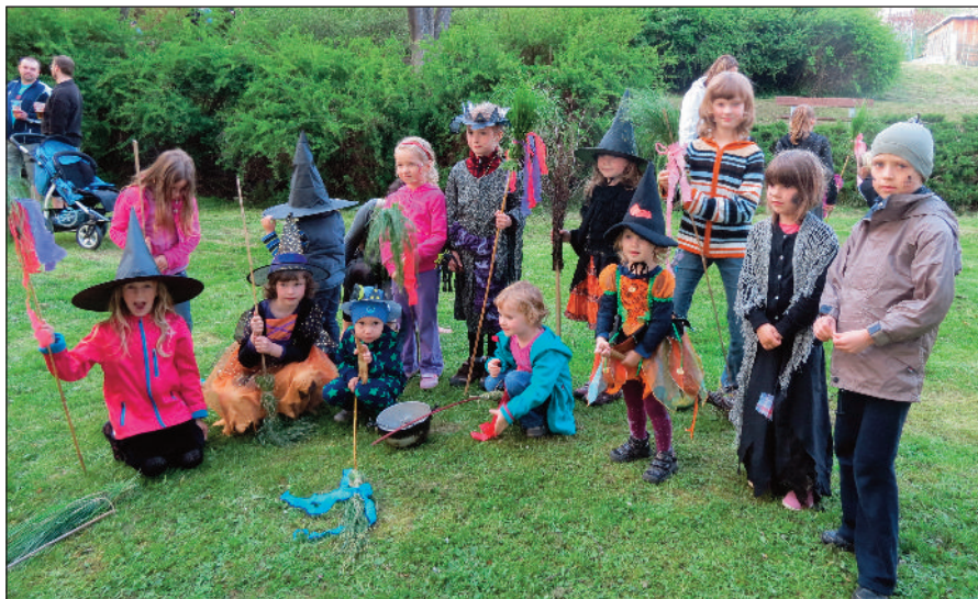
Slet malých čarodějek a čarodějů pořádal KOS Čkyně.

Jak již všichni víte, 30. dubna se ve Čkyni v parku stavěla májka. Tuto akci poprvé zorganizovali místní hasiči a skvěle se s tím vypořádali. Májka v parku stojí po roční odlmce, kdy ji v loňském roce neměl kdo postavit. Hasiči už týden před májkou měli brigádu na dřevo a na výběr pěkného rovného stromu. To se povedlo a v neděli před májkou se krásný strom