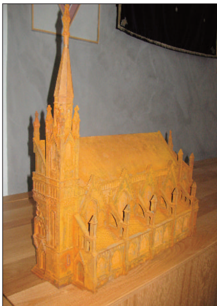
Model českobudějovické synagogy

základem naší expozice o židovské kultuře v regionu jižních Čech jsou modely čtyř synagog v jihočeském kraji, jež měly navždy zmizet ze světa? Modely českobudějovické, strakonické, tábořské a vimperské synagogy byly architektem zpracovány v měřítku 1:50 dle několika málo dochovaných fotografií a odlity z šedé litiny. Nejtěžší z nich, českobudějovická, nemá svojí vahou daleko do padesáti kilogramů.