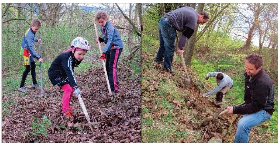
S úpravou trati pomáhali děti i rodiče z Outdoor Kids.