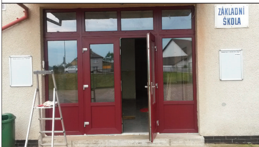
Nové vchodové dveře

cíl - rozvíjet osobnost žáka úměrně jeho schopnostem a nadání pro jeho budoucí uplatnění a učít jej odpovědnosti za vlastní chování a jednání v míře přiměřené jeho věku.