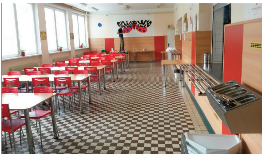
Jídelna v základní škole prodělala nejen rekonstrukci odpadů

Pro nastávající školní rok si kromě podrobně stanovených a rozpracovaných úkolů ve vzdělávacích a výchovných oblastech klademe za hlavní