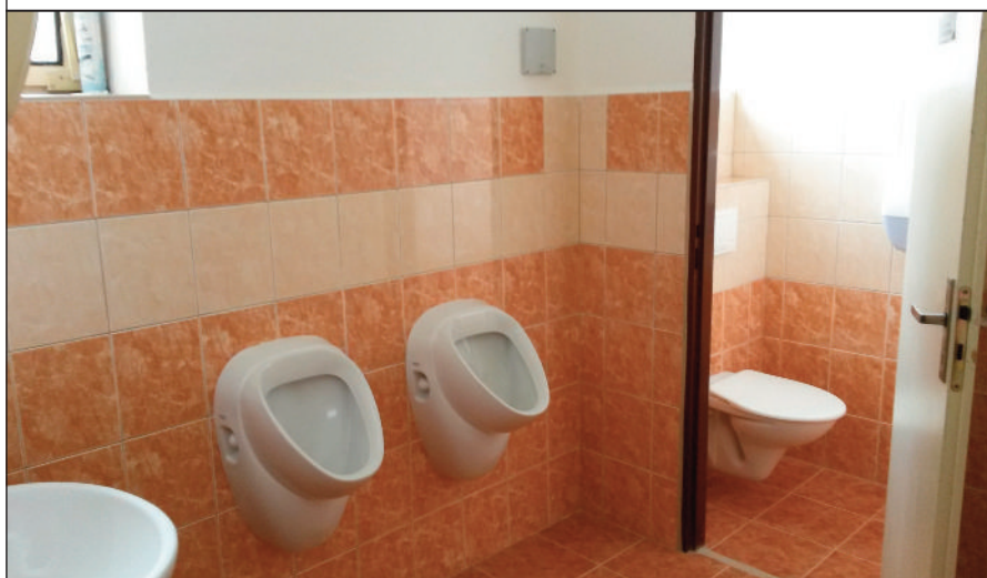
Kompletně zrekonstruované záchody