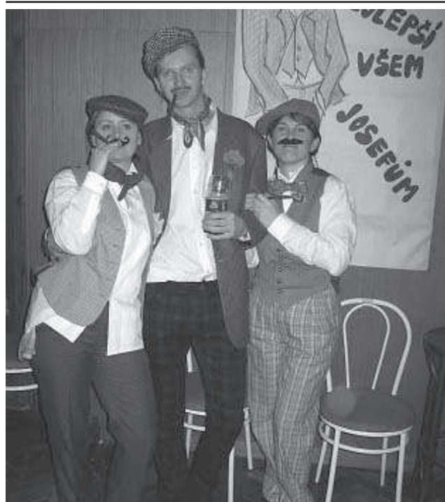
Josefovská úspěšně zakončila plesovou sezónu.