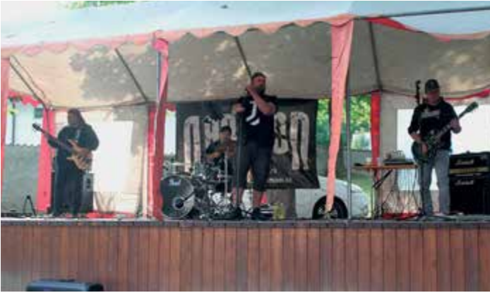
Skupina Nabeton na Foodfestivalu Čkyně.