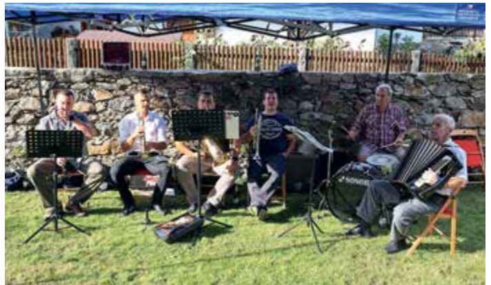
Hudební doprovod v synagoze.