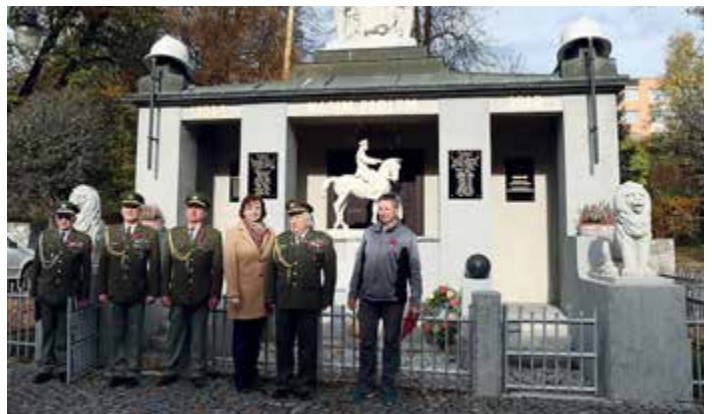
Uctění památky válečných veteránů 11. 11. 2023.