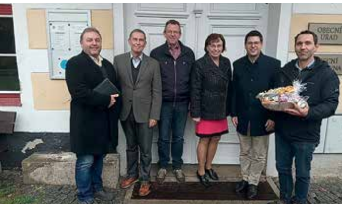
Návštěva z německého města Schönberg.