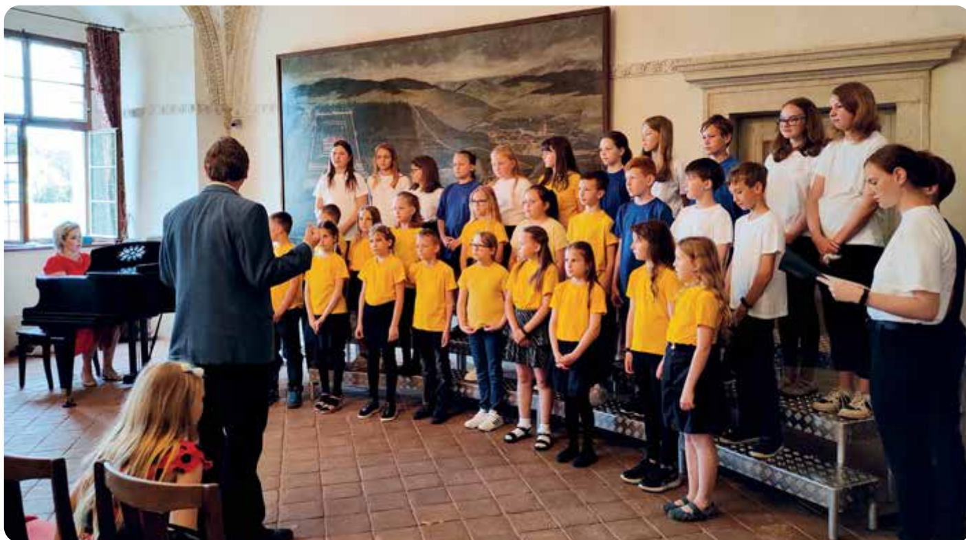
Dětský pěvecký sbor Růže na zámku Kratochvíle.