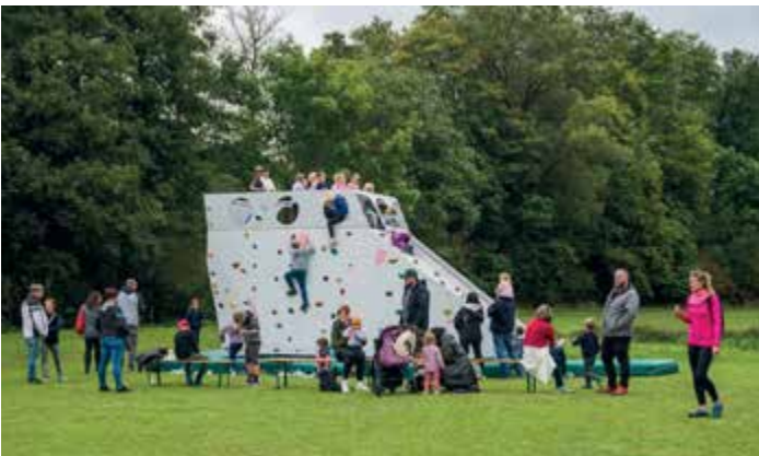
Horolezecká stěna ve Spůli.