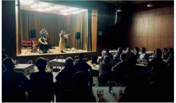
Skupina Bee Band ve Čkyni.