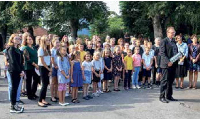
Pěvecký sbor Čkyně.