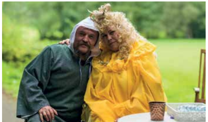
Strašidelný les ve Spůli.