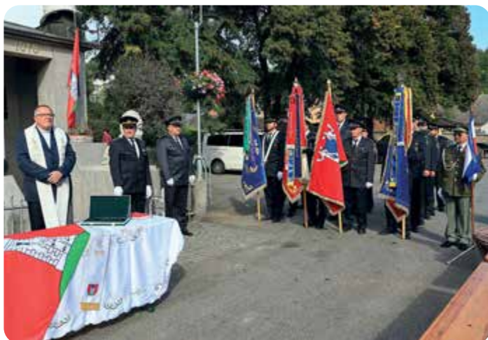
Slavnostní požehnání vlajky 28. 9. 2023.