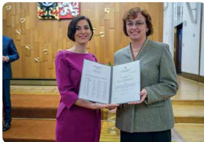
Slavnostní předání dekretu k vlajce 20. 11. 2023.

Tato vlajka bude viset na našem území jako symbol naší identity a jednoty při mnoha slavnostních příležitostech. Ať tato vlajka vždy vlaje s hrdostí nad naší obcí!