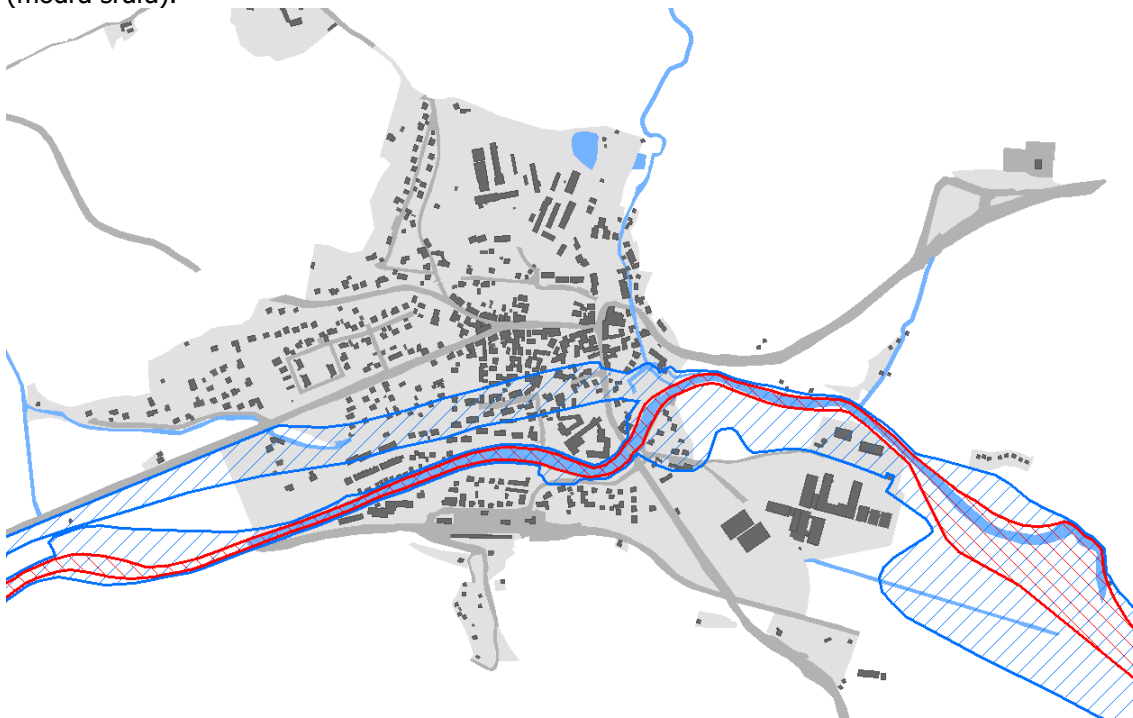
Schéma rozmístění ploch a staveb občanského vybavení (oranžový obrýs).

Vymezení aktivní zóny záplavového území (červená šrafa) a hladiny záplavového území Q100 (modrá šrafa).