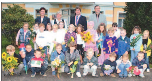
Letošní čkyňští prvňáčci