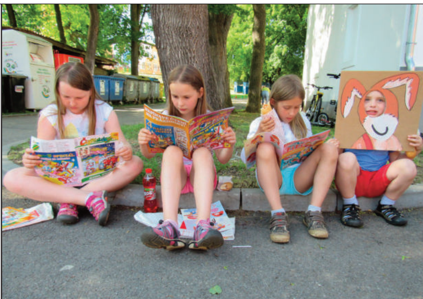
Měli jsme radost, že čtyřlístkové příběhy děti zaujaly