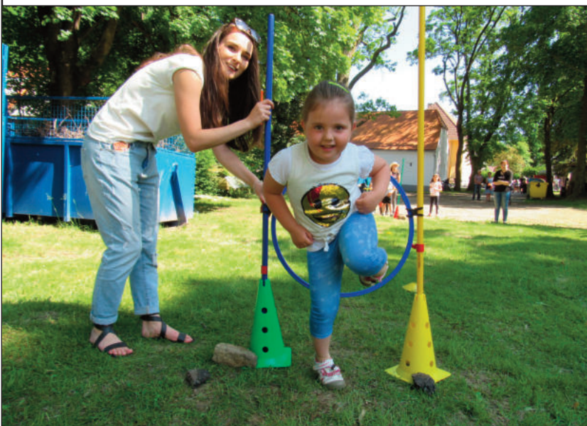
Pindaova překážková dráha