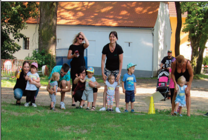
Závod batolat - závodníci na startu